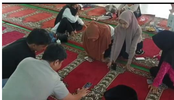
Gambar 2. Peserta Praktek Membuat Konten dan Mengelola Media Sosial didampingi oleh pemateri dan tim Pengabdian

Pelatihan manajemen organisasi juga diberikan secara sistematis. Materinya mencakup penyusunan rencana kerja, pembagian tugas yang proporsional, pembuatan laporan kegiatan, serta pengelolaan media sosial organisasi. Materi ini disampaikan langsung oleh Ketua Program Studi Pendidikan Matematika Universitas Dharmas Indonesia yang memiliki pengalaman panjang dalam mengelola organisasi dan aktif dalam berbagai kegiatan akademik maupun sosial kemasyarakatan. Kehadiran narasumber ini membantu peserta memahami praktik nyata manajemen organisasi, mulai dari perencanaan hingga evaluasi, sehingga mereka mampu mengelola kegiatan secara lebih profesional dan berkelanjutan. Untuk memperkuat kapasitas peserta, tim pengabdian juga menyusun dan membagikan modul pelatihan yang dapat digunakan sebagai panduan belajar mandiri. Modul ini berfungsi sebagai bahan rujukan praktis yang dapat dipakai kapan saja setelah kegiatan selesai, sehingga remaja masjid dapat terus mengembangkan diri baik dalam literasi digital maupun dalam pengelolaan organisasi.