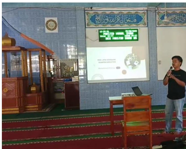
Gambar 1. Pelatihan Literasi Digital dan Budaya (Narasumber: Konten Kreator dan Seniman)