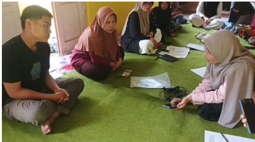
Gambar 3. Tim Pengabdian melaksanakan Pendampingan kepada Tim Media REMNIS

Pada tahap implementasi, peserta mulai mempraktikkan hasil pelatihan dengan membuat konten digital dan mengelola publikasi kegiatan di media sosial dan website. Konten yang diproduksi meliputi dokumentasi kegiatan remaja masjid, dakwah singkat, hingga promosi nilai budaya lokal. Target awal, yakni minimal dua konten per bulan dengan jumlah tayangan lebih dari 300 penonton dalam satu minggu, berhasil dicapai oleh tim media REMNIS.