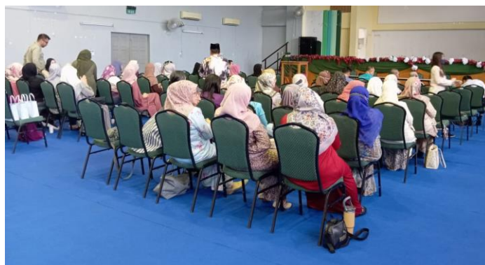
Gambar 2 Presentasi Eksplorasi Budaya

Hasil pelaksanaan PKM tersebut menunjukkan bahwa (1) Hasil kegiatan PKM Pelatihan penguatan etno-literasi numerasi bagi guru-guru sekolah dasar di Brunei Darussalam sebagai berikut, (2) Guru-guru mempunyai pengetahuan baru tentang etnopedagogi, (3) Guru-guru mampu menyusun langkah-langkah pembelajaran dan konten untuk penguatan literasi numerasi siswa berbasis etnopedagogi, (4) Guru-guru mampu mempraktikkan etno-literasi numerasi di dalam pembelajaran, dan (5) Guru-guru mampu mempresentasikan hasil penerapan etno-literasi numerasi di sekolah