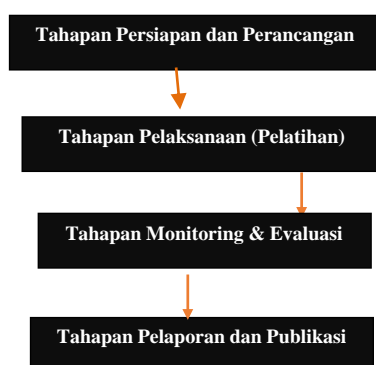
Gambar 3.1. Metode Pelaksanaan PKM

Metode pelaksanaan dalam Program Pengabdian Kepada Masyarakat dijelaskan pada bagan alir di bawah ini