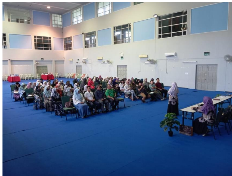
Gambar 2 Pelaksanaan PKM

PKM ini dilakukan pada tanggal 19 dan 21 Juli 2024 dengan sasaran 80 guru Persekutuan Guru-Guru Melayu Brunei (PGGMB) jenjang sekolah dasar sekolah dasar di Brunei Darussalam. Hasil Kegiatan PKM penugasan S2 Pendidikan dasar FIP Unesa sebagai berikut