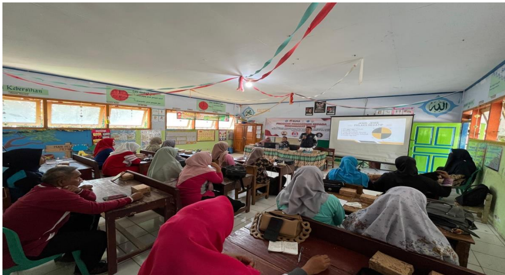
Gambar 3. Antusias dan semangat peserta kegiatan