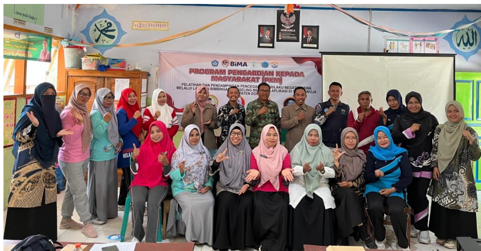
Gambar 4. Foto bersama tim PKM dengan peserta kegiatan (mitra)

Kegiatan diakhiri dengan pemberian cendera mata oleh tim PKM, serta serah terima teknologi (Aplikasi) dan foto bersama dengan peserta kegiatan (mitra) sebagai bukti terlaksananya kegiatan.