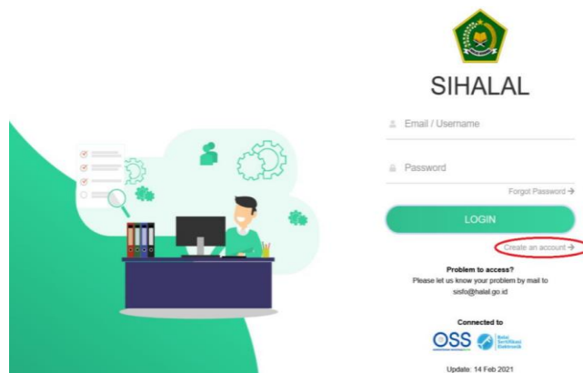
Gambar 8. Proses Pendaftaran SIHALAL

Program pendampingan ini diadakan untuk mengatasi berbagai kesulitan yang sering dihadapi oleh pelaku UMKM dalam mengisi dan menggunakan Sihalal. Banyak pelaku UMKM yang masih mengalami kesulitan, terutama yang berada di daerah-daerah yang kurang terjangkau atau yang memiliki keterbatasan dalam hal akses teknologi. Kendala-kendala ini meliputi kesulitan dalam memahami antarmuka sistem, kurangnya pengetahuan tentang data yang harus diisi, serta masalah teknis seperti koneksi internet yang tidak stabil. Ketidapahaman ini dapat menyebabkan kesalahan dalam pengisian formulir atau penundaan dalam proses sertifikasi, yang pada akhirnya bisa menghambat akses mereka ke pasar yang lebih luas dan mengurangi daya saing produk mereka.