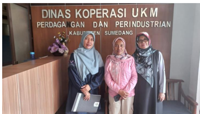
Gambar 5. Dokumentasi lanjutan kegiatan bersama Dinas Koperasi UKM Perdagangan dan Perindustrian Kabupaten Sumedang

Melalui rangkaian koordinasi ini, program pengabdian memperoleh dukungan menyeluruh baik dari aspek regulasi, pendanaan, maupun aspek sosial-keagamaan, yang menjadi fondasi