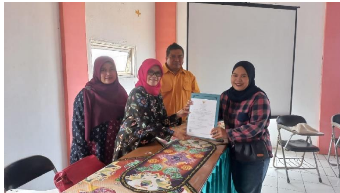
Gambar 10. Penyerahan Sertifikat Halal

Program ini bertujuan untuk meningkatkan pemahaman pelaku UMKM tentang manfaat sertifikasi halal dan prosesnya dalam bisnis. Sertifikasi halal menjamin kepatuhan terhadap standar syariat Islam dan menarik konsumen Muslim, sekaligus membuka akses ke pasar domestik dan internasional. Dengan bimbingan teknis, program ini diharapkan mempercepat proses sertifikasi halal bagi pelaku UMKM di Indonesia. Dukungan ini akan membantu mereka meningkatkan kredibilitas, daya saing, dan kualitas produk. Program ini juga mendukung upaya pemerintah untuk meningkatkan jumlah produk halal, menciptakan pasar yang lebih adil dan berkelanjutan.