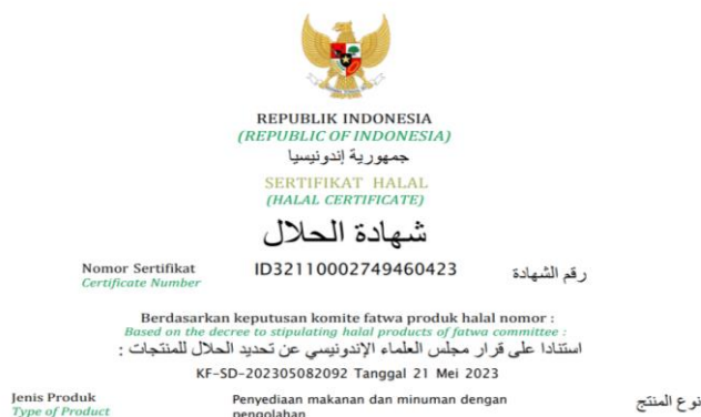
Gambar 11. Terbitnya Sertifikat Halal

Melalui pendampingan intensif, pelaku UMKM dapat lebih siap memenuhi persyaratan sertifikasi halal, yang berujung pada peningkatan kualitas produk. Sertifikasi halal tidak hanya menjamin kepatuhan terhadap syariat Islam, tetapi juga memperkuat daya saing produk di pasar lokal dan global, serta membantu pelaku UMKM memperluas jangkauan pasar dan meningkatkan citra produk. Sertifikasi halal oleh Majelis Ulama Indonesia (MUI) bertujuan untuk melindungi hak-hak konsumen, terutama Muslim, agar mereka dapat mengonsumsi produk yang aman dan sesuai prinsip syariat. Proses ini melibatkan audit ketat oleh berbagai lembaga terkait dan penentuan status halal melalui sidang oleh MUI, yang memastikan semua standar terpenuhi. Dalam konteks produk makanan, kualitas, kesehatan, dan keselamatan harus menjadi perhatian utama. Label halal menjadi indikator kepercayaan bagi konsumen, serta keunggulan kompetitif di pasar. MUI memastikan semua bahan dan proses produksi memenuhi syariat, menjamin produk yang beredar aman dan sesuai dengan nilai-nilai agama. Sertifikasi halal tidak hanya berdampak pada kepercayaan konsumen tetapi juga pada aspek ekonomi, di mana label halal meningkatkan loyalitas konsumen dan membedakan produk di pasar. Di pasar internasional, sertifikasi halal membuka peluang akses ke pasar dengan populasi Muslim yang signifikan, memberikan potensi pertumbuhan pendapatan (Bangun et al., 2024).