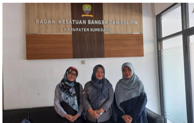
Gambar 4. Koordinasi dengan KESBANGPOL Kabupaten Sumedang untuk dukungan regulasi

Selanjutnya, dilakukan penguatan kerja sama kembali dengan Dinas Koperasi UKM Perdagangan dan Perindustrian Kabupaten Sumedang (Gambar 5), sebagai mitra utama dalam pelaksanaan program.