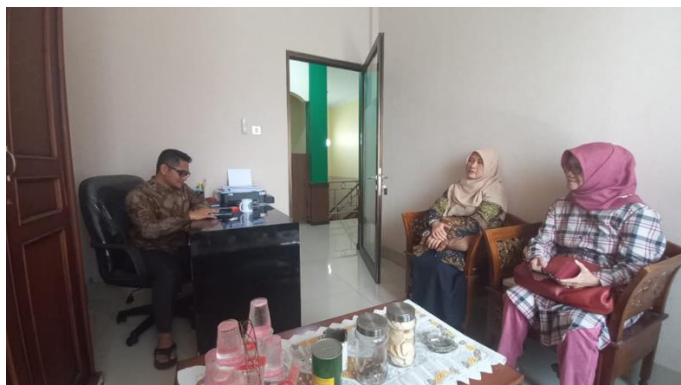
Gambar 3. Pertemuan dengan Masyarakat Ekonomi Syari'ah (MES) Kabupaten Sumedang

Koordinasi juga dilakukan dengan KESBANGPOL Kabupaten Sumedang (Gambar 4), yang mendukung dari sisi tata kelola dan regulasi, terutama dalam memfasilitasi keterlibatan lintas instansi.