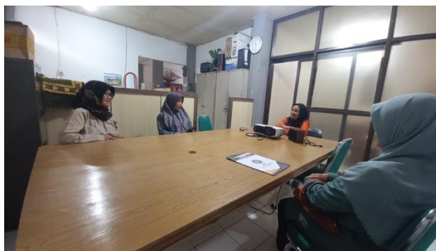
Gambar 2. Koordinasi kegiatan di Kantor Dinas Koperasi dan UMKM Kabupaten Sumedang

Dukungan berikutnya diperoleh dari Masyarakat Ekonomi Syariah (MES) Kabupaten Sumedang (Gambar 3), yang berperan dalam menguatkan aspek syariah sekaligus membangun