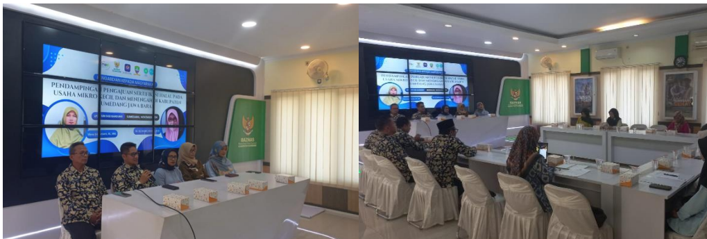
Gambar 6. Sosialisasi Sertifikasi Halal di Kabupaten Sumedang

Pelaksanaan sosialisasi sertifikasi halal bagi masyarakat yang memiliki UMKM di Kabupaten Sumedang merupakan bagian dari upaya strategis yang bertujuan untuk meningkatkan kualitas dan daya saing produk-produk lokal di pasar yang semakin kompetitif. Sertifikasi halal, yang memberikan jaminan bahwa produk-produk tersebut diproduksi sesuai dengan syariat Islam, menjadi aspek penting bagi pelaku UMKM, khususnya di daerah yang mayoritas penduduknya beragama Islam. Melalui sosialisasi ini, pelaku UMKM diharapkan dapat memahami secara mendalam mengenai urgensi dan manfaat dari sertifikasi halal, sehingga mereka termotivasi untuk mengimplementasikannya dalam kegiatan usahanya sehari-hari. Hal ini juga sejalan dengan program pemerintah dalam mewujudkan produk halal sebagai standar nasional, yang diatur dalam berbagai regulasi dan kebijakan.