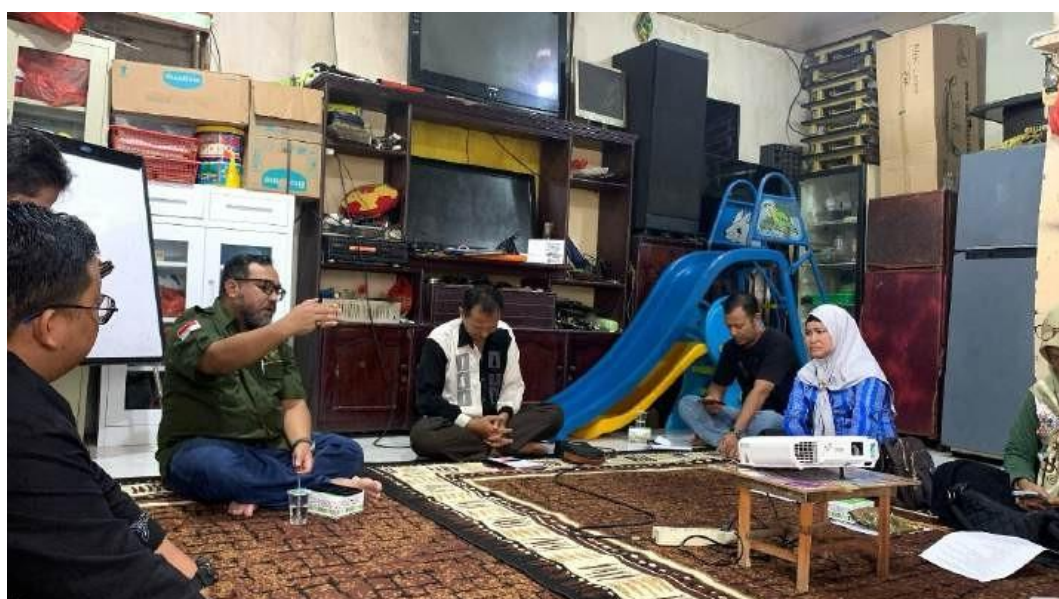
Gambar 2. Pemaparan Materi Oleh Narasumber