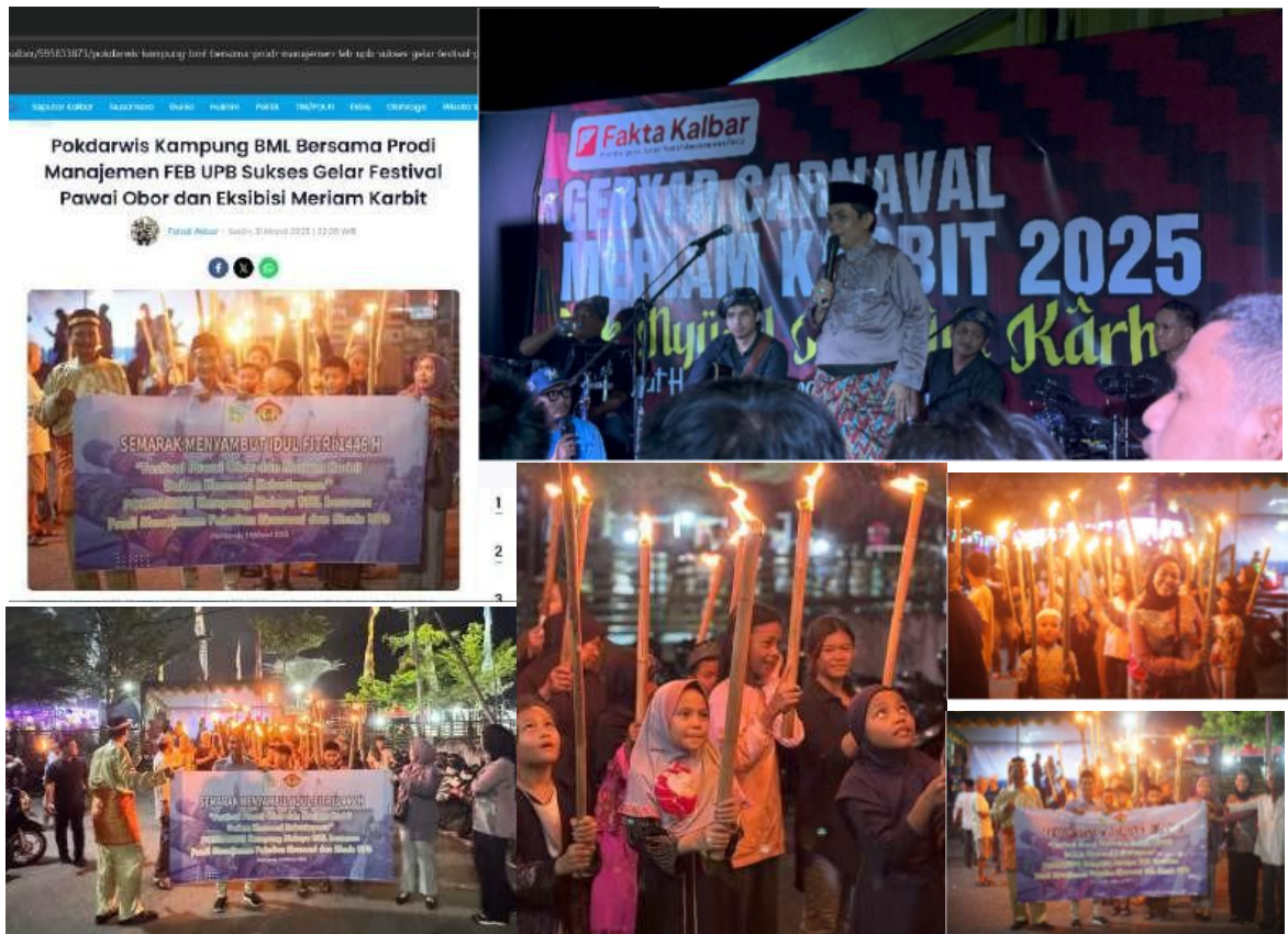
Gambar 4. Dokumentasi Kegiatan Event yang Terselenggara oleh Pokdarwis