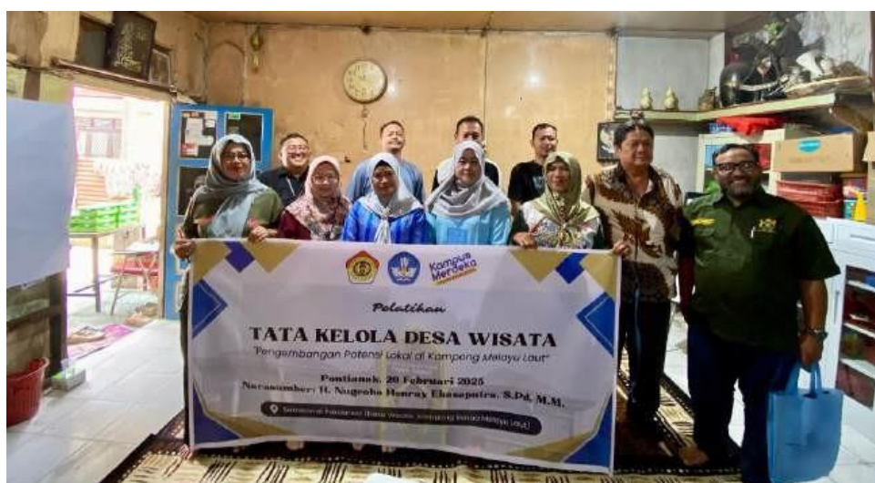
Gambar 1. Foto Bersama

Melalui pelatihan ini, Pokdarwis tidak hanya memperoleh peningkatan kapasitas dalam hal manajerial event, tetapi juga mampu mengimplementasikan pengetahuan tersebut dalam kegiatan nyata yang berdampak langsung terhadap citra dan daya tarik desa wisata. Bahwa kegiatan PKM ini berkontribusi langsung terhadap peningkatan kualitas tata kelola desa wisata yang berkelanjutan dan partisipatif.