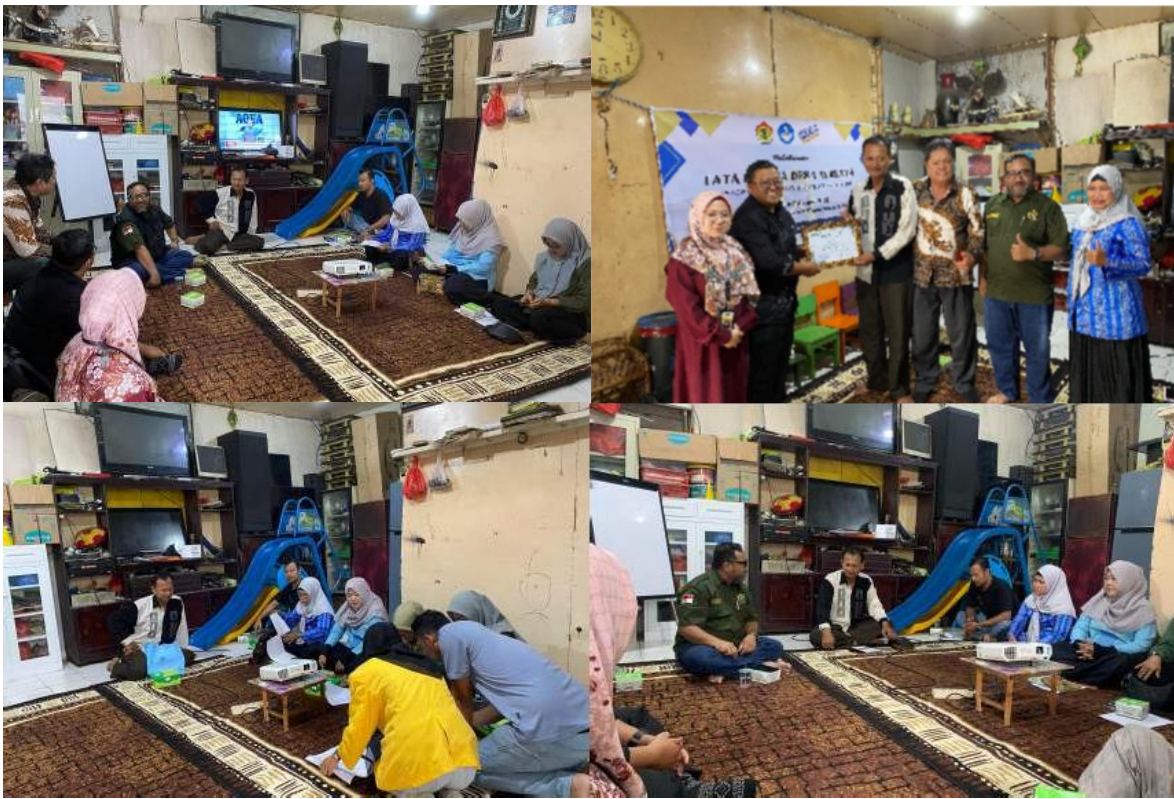
Gambar 3. Dokumentasi Kegiat