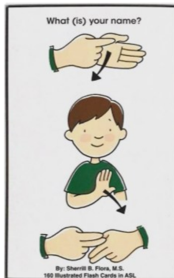
Gambar 2. Bahasa isyarat

Selain dengan menuliskan cara pengucapan di papan tulis, guru juga membantu pemahaman makna kepada murid dengan bahasa isyarat.