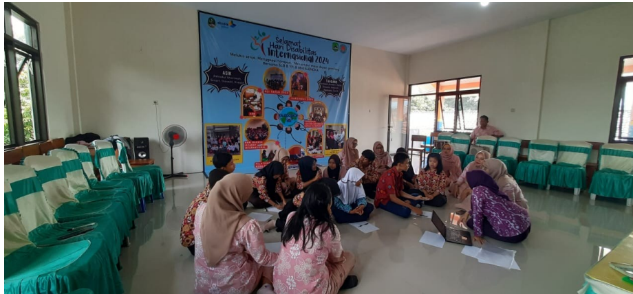
Gambar 1. Proses pelatihan menulis teks deskripsi

Selama pelatihan, guru membantu dengan menuliskan cara pengucapan kalimat dalam bahasa Inggris di papan tulis. Selain itu juga guru membantu menjelaskan dengan menggunakan bahasa isyarat.