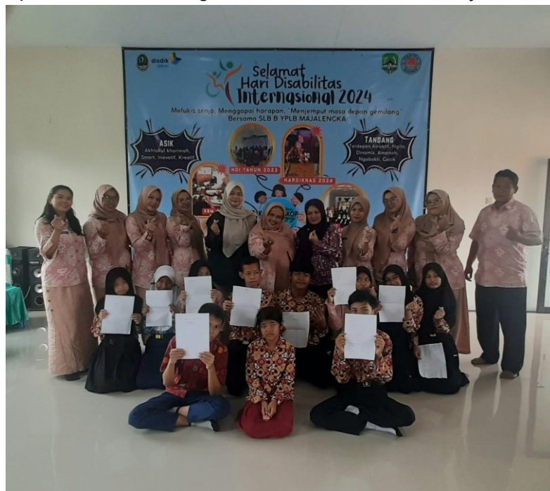
Gambar 4. Siswa menunjukkan hasil menulisnya.

Pada akhir sesi pelatihan siswa dengan antusias dan ceria menunjukkan lembar kerjanya.