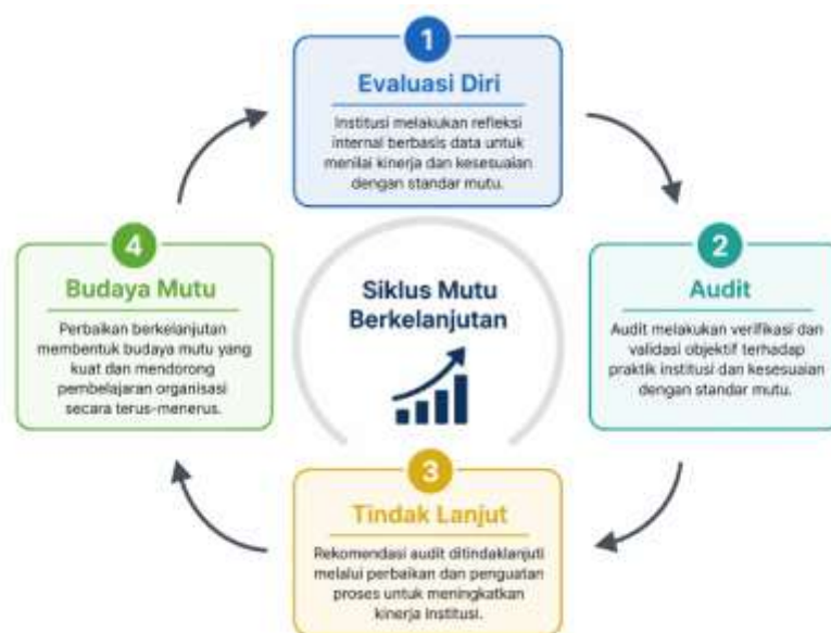
Gambar 2. Model Konseptual Integratif Penjaminan Mutu Pendidikan Tinggi

Berbeda dengan model linear konvensional, model ini menekankan adanya mekanisme siklikal ( continuous feedback loop ) yang memungkinkan terjadinya proses pembelajaran organisasi secara berkelanjutan. Dalam model ini, budaya mutu tidak hanya diposisikan sebagai output akhir, tetapi juga sebagai faktor penguat ( reinforcing variable ) yang mempengaruhi kualitas siklus berikutnya. Dengan demikian, semakin kuat budaya mutu yang terbentuk, semakin efektif pula proses evaluasi diri dan audit mutu pada siklus selanjutnya.