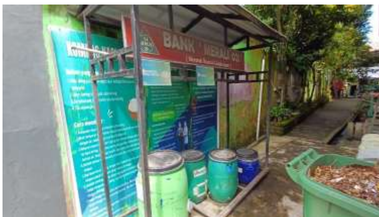
Gambar 3. Pengelolaan Bank Kompos Sekolah oleh Siswa dan Guru