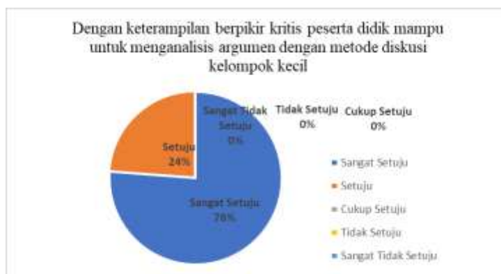
Gambar 3. Diagram hasil penyebaran kuesioner menganalisis argumen

Temuan tersebut juga mendukung prinsip Kurikulum Merdeka, yang menekankan pentingnya keterampilan berpikir kritis bagi peserta didik. Hal ini juga diperkuat dengan hasil kuesioner terhadap 21 peserta didik kelas VIII-B, diketahui bahwa 76% menyatakan sangat setuju terhadap pernyataan bahwa keterampilan berpikir kritis melalui metode diskusi kelompok kecil membantu mereka dalam menganalisis argumen.