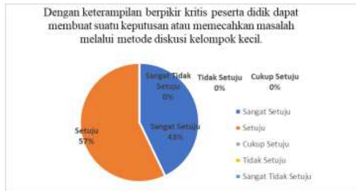
Gambar 4. Diagram hasil penyebaran kuesioner membuat keputusan atau memecahkan masalah

berpikir kritis membantu mereka dalam membuat keputusan dan memecahkan masalah melalui metode diskusi kelompok kecil.