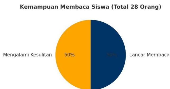
Gambar 1. Kemampuan Membaca Permulaan

Berdasarkan hasil tes yang dilakukan yaitu tes membaca permulaan, observasi, dan dokumentasi dari 28 siswa terdapat 14 siswa yang memiliki kesulitan membaca permulaan yang dapat di gambarkan pada diagram di bawah :