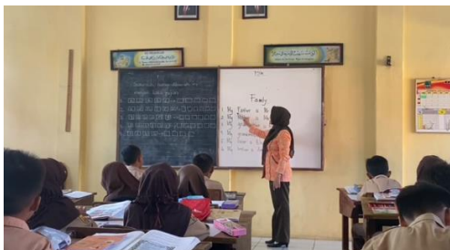
Gambar 5. Media ajar berupa papan tulis

Pembelajaran di kelas rendah pada Sekolah Dasar ini, guru masih menggunakan media ajar berupa papan tulis, hal tersebut dikarenakan media yang disediakan sekolah masih terbatas untuk kelas rendah Pelaksanaan kegiatan pembelajarannya hanya sebatas mendengarkan ceramah atau penjelasan dari guru. Hal tersebut sangat berdampak besar bagi peserta didik karena akan mempengaruhi pada tingkat minat siswa membaca.