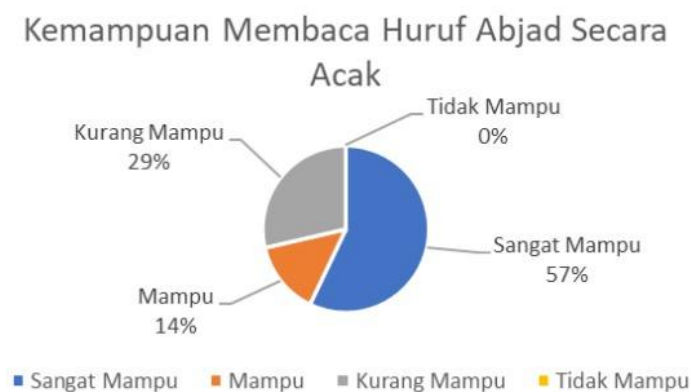
Gambar 2. Kemampuan Membaca Huruf Abjad

Sesuai dengan gambar 2 bahwa kemampuan siswa dalam membaca huruf abjad yaitu, 57% siswa sangat mampu membaca huruf abjad secara acak, 14% siswa mampu membaca huruf abjad secara acak, 29% siswa kurang mampu membaca huruf abjad secara acak, dan 0% siswa tidak mampu membaca huruf abjad secara acak. Beberapa siswa kelas I SD Negeri Tonjong 1 mengalami kendala dalam membedakan dan melafalkan huruf. Kesulitan yang muncul di antaranya: