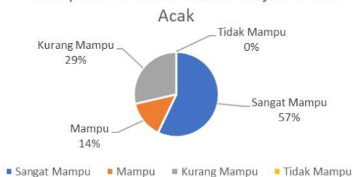
Gambar 3. Kemampuan Membaca Huruf Abjad

Berdasarkan gambar 3, kemampuan yang dimiliki siswa dalam membaca kata yang mengandung gabungan huruf konsonan yaitu 0% siswa sangat mampu membaca kata yang mengandung gabungan huruf konsonan, 0% siswa mampu membaca kata yang mengandung gabungan huruf konsonan, 14% siswa kurang mampu membaca kata yang mengandung gabungan huruf konsonan, dan 86% siswa tidak mampu membaca kata yang mengandung gabungan huruf konsonan. Dari hasil di atas dapat dilihat bahwa hampir seluruh siswa kelas I SD Negeri Tonjong 1 yang mengalami kesulitan membaca permulaan tidak mampu membaca kata yang mengandung gabungan huruf konsonan. Contohnya pada kata senang, bangsa, hidung, dan lain - lain. Namun pada gabungan huruf konsonan 'kh', 'ny', dan 'sy', sebagian besar siswa sama sekali tidak mampu membaca