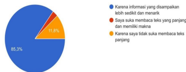
Gambar 2. Preferensi Media Audiovisual Generasi Z

Mengapa Anda sebagai Gen-Z lebih menyukai informasi yang ada di media audio-visual seperti TikTok, YouTube, meskipun informasi yang disampaikan kurang lengkap? 34 jawaban