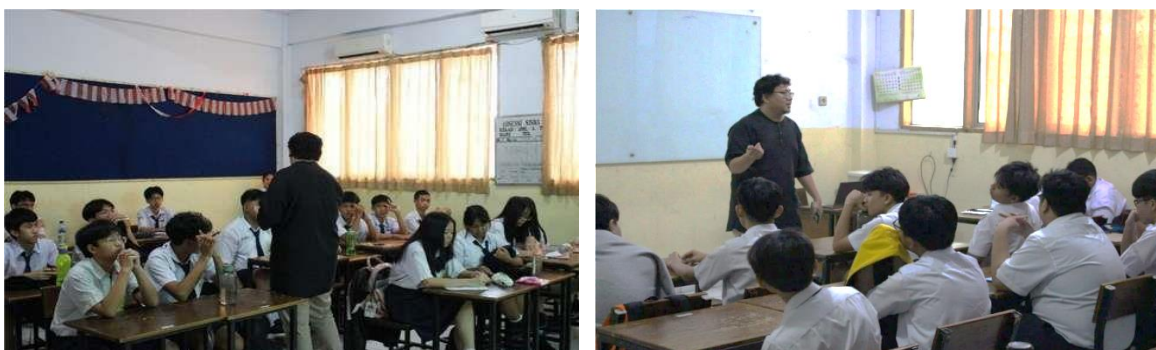
Gambar 7. Kegiatan Pemaparan

Kegiatan sosialisasi dilakukan dalam 2 sesi pada dua kelas di SMA Dharma Putra.