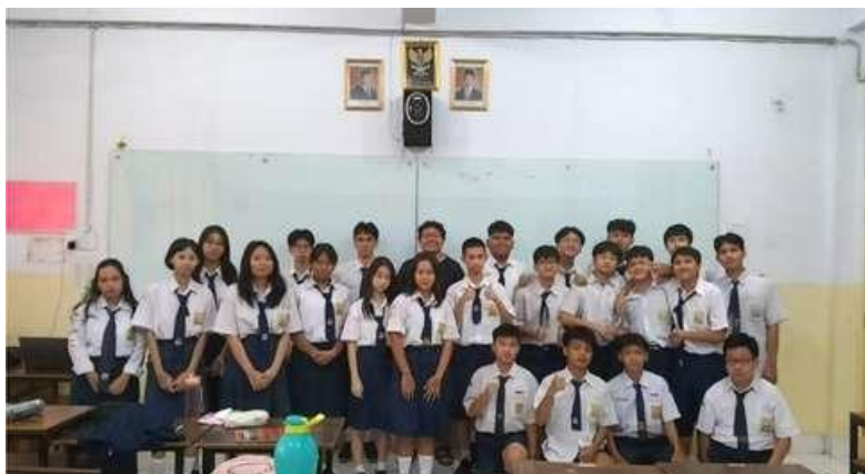
Gambar 9. Foto Bersama Peserta

Setelah selesai kegiatan pemaparan dilakukan foto bersama dengan peserta sosialisasi