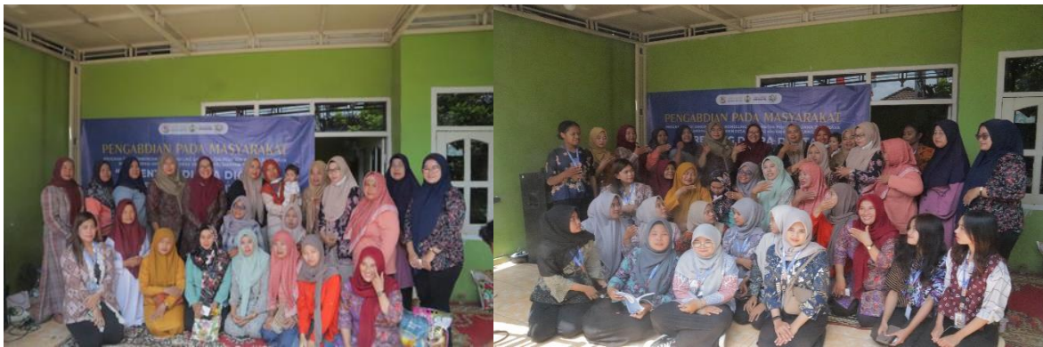
Gambar 2. Penyuluhan parenting Ibu-ibu Gen. Z Gambar 3. Kolaborasi Tim Dosen & Mhs KKN