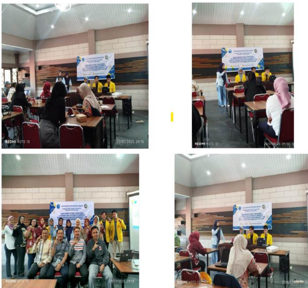
Gambar 3. Photo Kegiatan Pelatihan dan Wokshop Bersama Anggota Koperasi UMKM Bumi Cianjur

Pelatihan diberikan dalam bentuk presentasi interaktif mengenai konsep dasar digital marketing, strategi penggunaan media sosial, pengenalan dan praktik penggunaan Canva, serta tips branding dan copywriting . Seluruh peserta menunjukkan antusiasme tinggi, dan berdasarkan pre-test dan post-test, terdapat peningkatan pemahaman rata-rata sebesar 42%. Sebanyak 85% peserta berhasil membuat minimal satu konten promosi yang layak dipublikasikan.