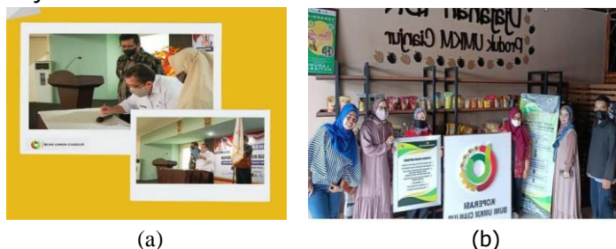
Gambar 1. (a) Photo Pengesahan Koperasi Bumi Cianjur (b) Photo Kegiatan aktivitas Anggota UMKM Bumi Cianjur

berasal dari wilayah Kecamatan Karangtengan dan Bojong, yang berlokasi di Jalan Raya Bandung Bojong, Cianjur.