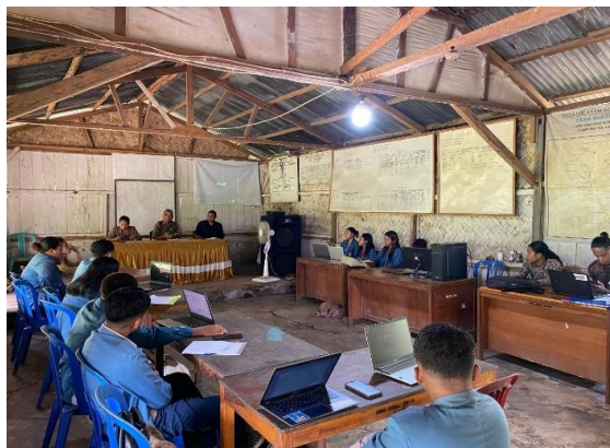
Gambar 1 Proses Diskusi Bersama Aparat Desa

Forum kerja ini diharapkan menjadi awal momentum awal penting untuk masalah bahwa setiap aparat desa diperkenalkan secara utuh dalam program ini, dan harapannya mendapat dukungan penuh dari semua pihak dari implementasi sampai pada tahap evaluasi.