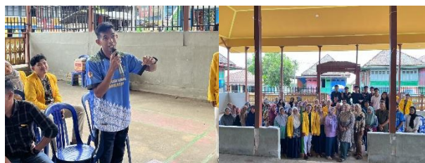
Gambar 2. Kegiatan sosialisasi dan diskusi bersama masyarakat sebagai bagian dari perumusan visi bersama "Desa Cerdas Berbasis Literasi dan Potensi Lokal"

Tahap Dream dilakukan melalui forum diskusi partisipatif yang melibatkan perwakilan dari lima dusun. Warga bersama tim mahasiswa merumuskan mimpi bersama mewujudkan "Desa Cerdas Berbasis Literasi dan Potensi Lokal." Proses sosialisasi program juga menjadi bagian dari tahap ini, di mana tim mahasiswa memperkenalkan konsep Pojok Literasi Terpadu dan mengajak masyarakat untuk bersama-sama menentukan arah pengembangannya, seperti terlihat pada Gambar 2.