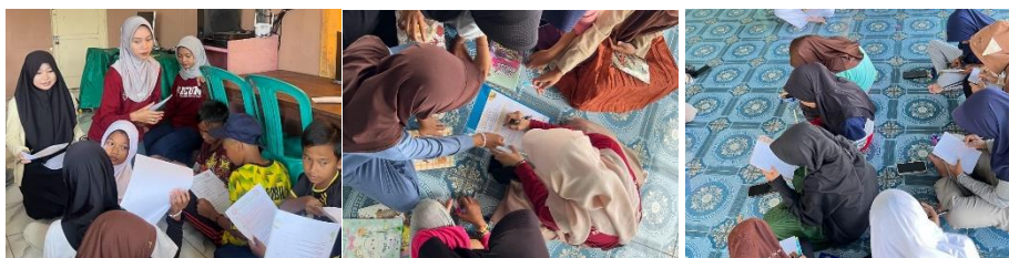
Gambar 5. Dokumentasi pelaksanaan post-test dan observasi kegiatan literasi oleh peserta

Secara keseluruhan, hasil evaluasi menunjukkan bahwa program pengabdian ini berhasil memperkuat karakter religius, meningkatkan kepedulian lingkungan, serta menumbuhkan budaya literasi masyarakat Desa Burai. Tingkat ketercapaian program dinilai sangat baik, ditunjukkan oleh peningkatan skor pengetahuan peserta di atas 70%, partisipasi aktif masyarakat dalam seluruh kegiatan pojok, serta terbentuknya Kelompok Kerja Literasi dan Lingkungan Desa sebagai wujud keberlanjutan program pascaimplementasi.