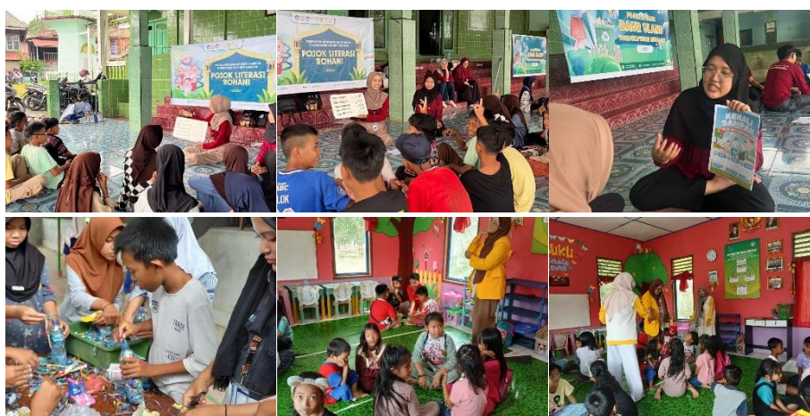
Gambar 3. Pelaksanaan kegiatan di tiga pojok literasi : Pojok Rohani, Pojok Daur Ulang, dan Pojok Baca ( Design )

Kegiatan pelaksanaan program di tiga pojok literasi berlangsung secara partisipatif, melibatkan anak-anak, remaja, hingga ibu rumah tangga, seperti terlihat pada Gambar 3.