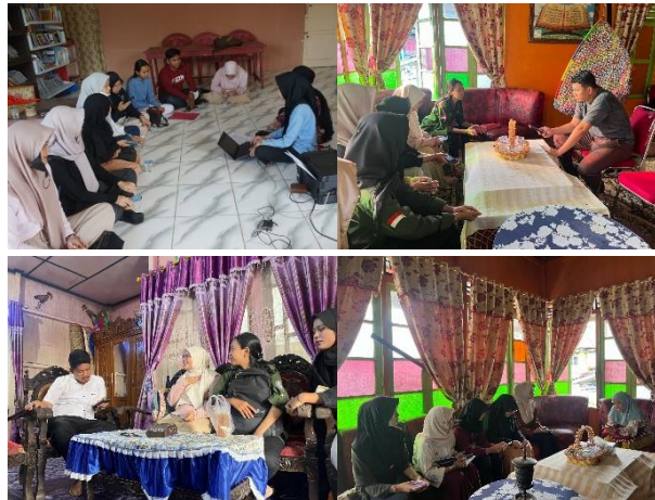
Gambar 1. Kegiatan FGD bersama perangkat desa dalam tahap Discovery

Pada tahap Discovery , tim melakukan pemetaan aset melalui observasi, wawancara, survei, dan Focus Group Discussion (FGD) bersama perangkat desa, tokoh masyarakat, dan warga dari lima dusun. Kegiatan tersebut menjadi langkah awal dalam menggali potensi lokal masyarakat, seperti terlihat pada Gambar 1.