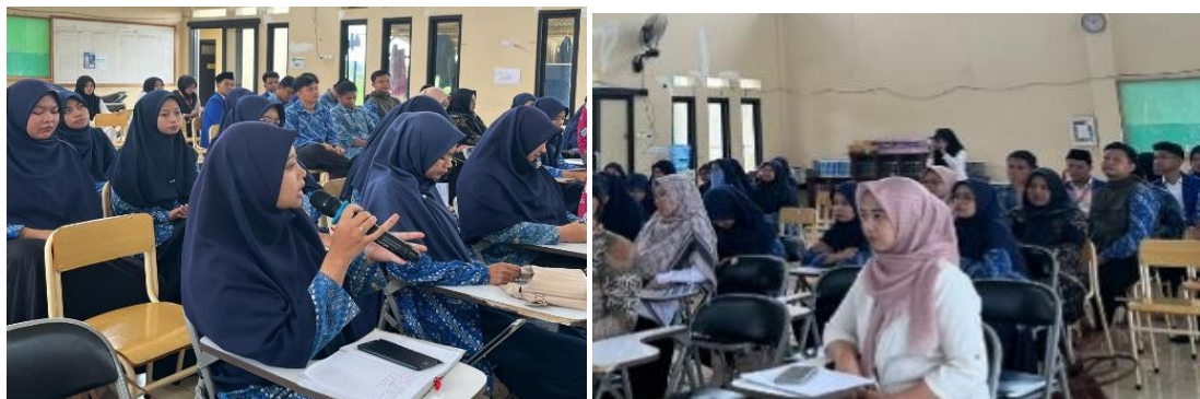
Gambar 2 Kegiatan PKM Guru

Berikut foto dokumentasi selama kegiatan PKM berlangsung :