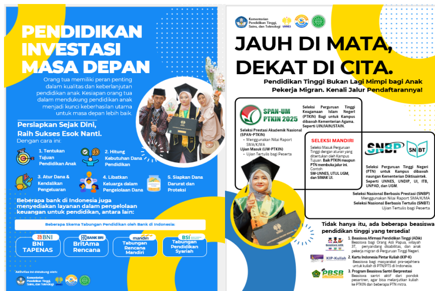
Gambar 2. Leaflet Pendidikan Investasi Masa Depan Akses dan Pendidikan di Level Perguruan Tinggi

Pembuatan leaflet dilakukan menyusun media dalam kegiatan pengabdian sehingga memudahkan dalam sharing informasi kepada peserta, dimana terdapat 2 leaflet yang dibuat, yaitu leaflet Pendidikan investasi masa depan yang berisikan informasi terkait strategi dalam mempersiapkan pendidikan anak pekerja migran Indonesia, dimulai dari (1) Tentukan tujuan pendidikan anak; (2) Hitung kebutuhan dana pendidikan; (3) Atur dana dan kendalikan pengeluaran; (4) Libatkan keluarga dalam pengelolaan pendanaan; dan (5) Siapkan dana darurat dan proteksi. Selain itu dalam leaflet ini juga memberikan informasi terkait beberapa skema tabungan pendidikan oleh bank di Indonesia, diantaranya BNI Tapenas, BritAma Rencana, Tabungan Rencana Mandiri, Tabungan Pendidikan Syariah.