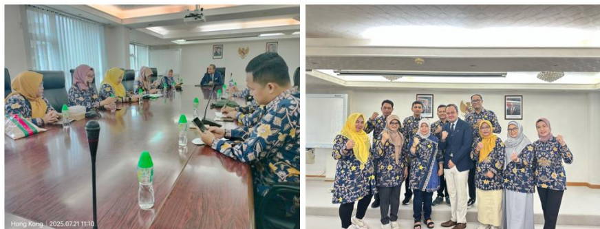
Gambar 7. Kegiatan Tim Pengabdian di KJRI Hongkong

Pada tahapan akhir dari kegiatan pengabdian ini adalah kunjungan ke Konsulat Jenderal Republik Indonesia di Hong Kong, dimana dalam kegiatan tersebut Tim Pengabdian LPPM UNNES menyampaikan program kegiatan yang telah dilakukan terkait pengabdian dengan PMI PCIA dan menyampaikan beberapa peluang kerjasama antara UNNES dengan KJRI Hongkong, diantaranya KKN Kebangsaan, Peluang kuliah doktoral dan Publikasi bersama dari hasil penelitian dan pengabdian yang dapat dipublish di jurnal-jurnal UNNES yang telah terakreditasi.