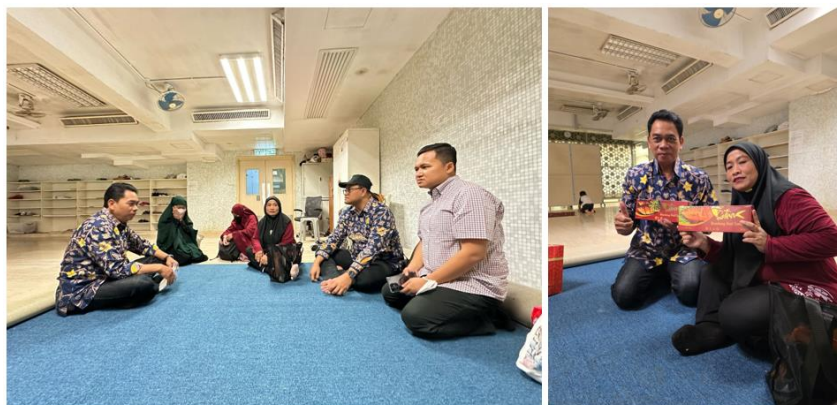
Gambar 6. Sosialisasi kepada PMI dan Pemberian Produk TTG LPPM UNNES

Kegiatan pengabdian selanjutnya juga dilakukan pada hari berikutnya, hari Senin tanggal 21 Juli 2025 dengan bertempat di Islamic Centre Hongkong, dimana peserta pelatihan sebagian merupakan anggota PCIA Hongkong dan PMI yang saat itu berada di masjid untuk menjalankan ibadah sholat dzuhur. Pada kegiatan tersebut terdapat sekitar 15 PMI yang menerima kegiatan sosialisasi terkait pentingnya pengelolaan keuangan untuk akses pendidikan dan mereka menyambut baik dari informasi yang diberikan. Selain itu dalam kegiatan tersebut juga diberikan souvenir dan bandeng presto yang merupakan produk dari Teknologi Tepat Guna (TTG) peneliti dan pengabdian dosen UNNES, dimana kegiatan tersebut juga merupakan salah satu strategi go international dari produk-produk LPPM UNNES.