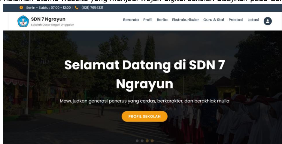
Gambar 1. Tampilan Halaman Utama Website SDN 7 Ngrayun

Luaran utama dari kegiatan pengabdian ini adalah sebuah sistem informasi berbasis website yang fungsional dan representatif untuk SDN 7 Ngrayun. Website ini dirancang dengan antarmuka yang modern, bersih, dan mudah diakses untuk memberikan pengalaman pengguna yang baik. Tampilan halaman utama website yang menjadi wajah digital sekolah disajikan pada Gambar 1.