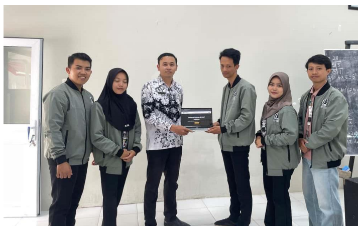
Gambar 3. Serah Terima Website kepada Pihak SDN 7 Ngrayun

Puncak dari kegiatan pengabdian ini adalah proses serah terima website kepada pihak sekolah, yang didokumentasikan pada Gambar 3. Momen ini bukan hanya sekadar penyerahan produk secara simbolis, tetapi juga menandai transfer pengetahuan melalui sesi pelatihan admin serta penyerahan aset digital secara resmi kepada pihak sekolah untuk dikelola secara mandiri.