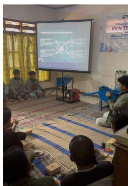
Gambar 6. Foto bersama setelah Sosialisasi Mesin Pencacah