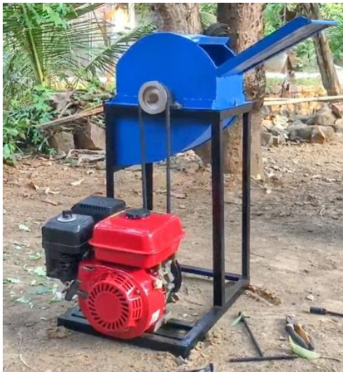
Gambar 4. Mesin Pada tahap finishing