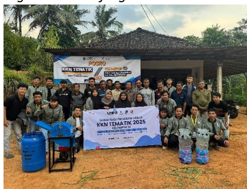
Gambar 7. Sosialisasi Mesin pencacah

Kegiatan sosialisasi dihadiri oleh sekitar 20 orang perwakilan warga dan dilaksanakan dengan metode penyuluhan serta demonstrasi langsung. Dalam kegiatan ini, tim KKN menunjukkan cara kerja mesin mulai dari pengisian bahan hijauan, proses pencacahan, hingga hasil silase yang siap diberikan kepada ternak. Selain itu, masyarakat juga diberi kesempatan untuk mencoba mengoperasikan mesin secara langsung sehingga lebih memahami prosedur penggunaannya. Melalui sosialisasi ini, warga tidak hanya melihat hasil nyata dari program