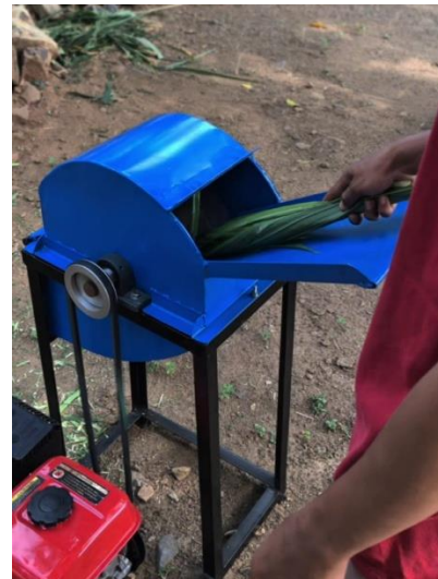
Gambar 5. Uji coba mesin pencacah

Hasil rancang bangun mesin pencacah rumput ditunjukkan pada Gambar 9. Mesin ini menggunakan motor bakar sebagai sumber tenaga penggerak yang dikombinasikan dengan pulley, sehingga menghasilkan putaran sekitar 1500 rpm. Prinsip kerjanya adalah meneruskan putaran dari motor penggerak melalui pulley ke poros utama, yang kemudian digunakan untuk mencacah rumput.