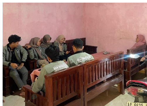
Gambar 3. Observasi Lingkungan 2

Berdasarkan pertimbangan yang telah dilakukan, tim memutuskan untuk merancang mesin pencacah rumput dengan saluran pemasukan di bagian depan dan saluran pengeluaran di bagian bawah, sebagaimana ditunjukkan pada Gambar 1. Mesin ini terdiri atas beberapa komponen, antara lain motor bensin berdaya 5,5 hp sebagai penggerak, rangka dari besi siku berukuran 30 x 30 mm dengan ketebalan 3 mm, sistem transmisi menggunakan pulley berdiameter 10 cm yang dihubungkan dengan V-belt tipe B-72, empat bilah pisau pencacah berbahan high speed steel (HSS) yang dipasang dengan sambungan baut, serta pelindung (cover) dari plat dengan ketebalan 0,8 mm. Keberhasilan kegiatan ini ditandai dengan terwujudnya mesin pencacah rumput yang dapat dimanfaatkan untuk pakan ternak kambing berikut ini merupakan langkah-langkah pembuatan mesin pencacah ternak kambing dan pembuatan silase.