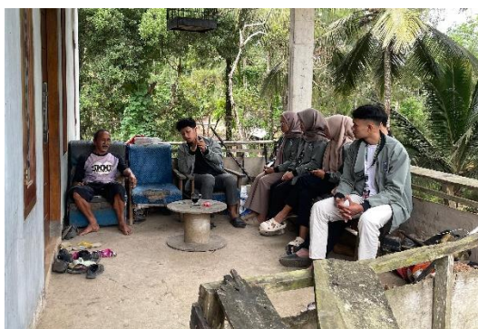
Gambar 2. Observasi Lingkungan 1

Kegiatan pengabdian dilaksanakan sesuai dengan rencana yang telah disusun oleh tim. Tahap awal dimulai dengan persiapan berupa observasi lingkungan sebagai bentuk pendekatan kepada masyarakat di Dusun Tanjung, Desa Ngrayun, Kecamatan Ngrayun, Kabupaten Ponorogo, serta observasi kepada pihak-pihak terkait. Dari hasil observasi, diperoleh informasi bahwa pakan ternak merupakan kebutuhan terbesar dalam usaha peternakan masyarakat setempat, sementara proses pencacahan hijauan masih dilakukan secara manual sehingga memerlukan banyak waktu dan tenaga. Berdasarkan temuan tersebut, tim berinisiatif menyusun rancangan solusi berupa pembuatan mesin pencacah hijauan yang diharapkan dapat membantu masyarakat dalam mempercepat dan mempermudah pengolahan pakan ternak. Pada gambar 2 dan 3 dibawah ini merupakan dokumentasi diskusi tim pengabdian masyarakat terkait perencanaan pembuatan mesin pencacah pakan kambing.