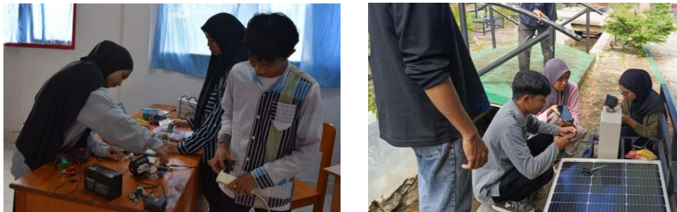
Gambar 3: Proses Uji Coba Alat

Setelah tahap pemrograman selesai, selanjutnya dilakukan pengujian alat untuk memastikan sistem bekerja sesuai fungsi yang dirancang, sensor pelampung diprogram agar dapat mendeteksi kenaikan air pada batas tertentu, kemudian mengirimkan sinyal ke Arduino untuk mengaktifkan sirine sebagai tanda peringatan. Hasil uji coba yang dilakukan pada tanggal 26 Juli 2025 menunjukkan bahwa ketika pelampung terkena air, sirine berbunyi dengan respons cepat, yaitu kurang dari dua detik (Gambar 3). Selanjutnya, pada uji coba skala kecil yang dilaksanakan pada tanggal 28 Juli 2025 di saluran air sekitar kampus Universitas Sembilanbelas November Kolaka, sistem terbukti bekerja dengan baik dan mampu memberikan peringatan sesuai dengan perubahan ketinggian air.