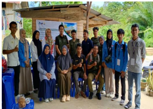
Gambar 6: Sosialisasi Alat Deteksi Banjir