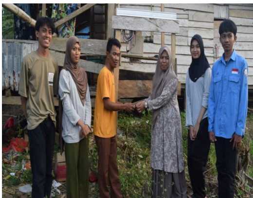
Gambar 7: Serah Terima Alat Mitigasi Banjir kepada Kepala Desa Sumber Rejeki