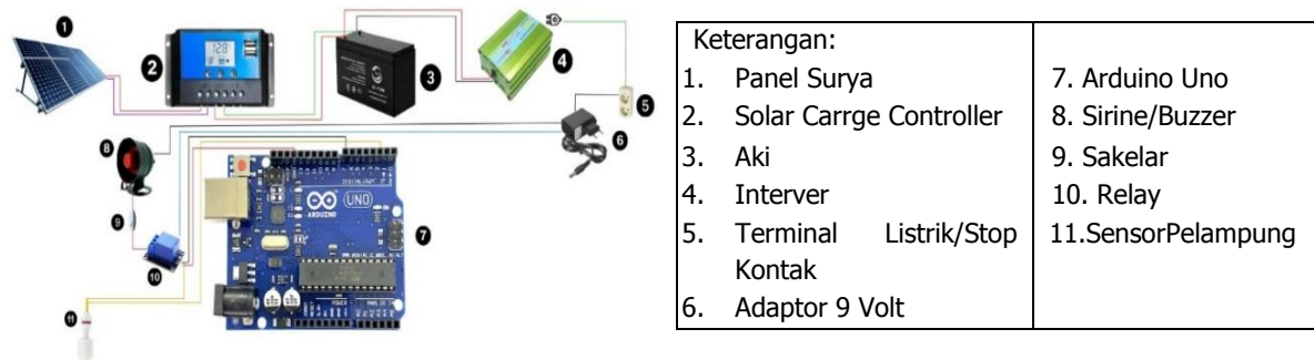
Gambar 1: Desain Alat Mitigasi Banjir

Pelaksanaan kegiatan Studi Independent Mandiri dan Berdampak (SIM-B) di Desa Sumber Rejeki menghasilkan produk berupa alat peringatan dini banjir berbasis Arduino Uno yang dapat dimanfaatkan masyarakat untuk meningkatkan kesiapsiagaan terhadap bencana banjir. Alat ini dirancang dengan memanfaatkan Arduino Uno sebagai komponen utama. Desain alat dapat dilihat pada Gambar 1.