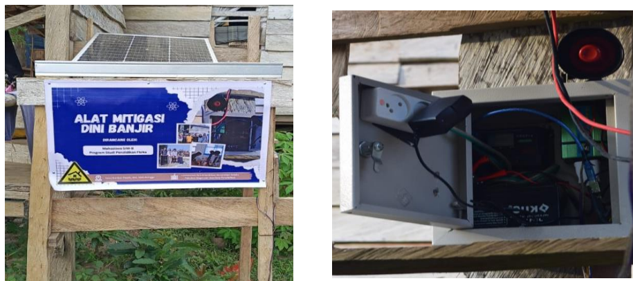
Gambar 5: Pemasangan Alat secara Permanen

Selanjutnya dilakukan pemasangan alat di Desa Sumber Rejeki, sistem peringatan dini banjir yang telah diuji coba sebelumnya dipasang secara permanen di lokasi yang telah ditentukan, yaitu di sekitar aliran sungai yang sering meluap. Pemasangan dilakukan dengan memastikan posisi sensor pelampung berada pada ketinggian yang tepat agar dapat mendeteksi perubahan air secara akurat. Selain itu, panel surya, aki, serta rangkaian pendukung lainnya juga dipasang dengan rapi agar alat dapat beroperasi secara optimal dan tahan terhadap kondisi lingkungan luar.