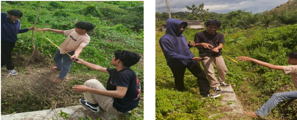
Gambar 4: Proses Pengukuran Lebar dan Tinggi Sungai

Selanjutnya dilakukan pemasangan alat di Desa Sumber Rejeki, sistem peringatan dini banjir yang telah diuji coba sebelumnya dipasang secara permanen di lokasi yang telah ditentukan, yaitu di sekitar aliran sungai yang sering meluap. Pemasangan dilakukan dengan memastikan posisi sensor pelampung berada pada ketinggian yang tepat agar dapat mendeteksi perubahan air secara akurat. Selain itu, panel surya, aki, serta rangkaian pendukung lainnya juga dipasang dengan rapi agar alat dapat beroperasi secara optimal dan tahan terhadap kondisi lingkungan luar.