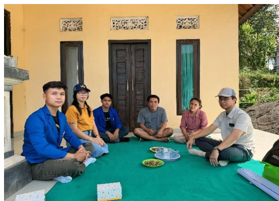
Gambar 3. Mitra Produksi Batako

Pengadaan beberapa peralatan yang diperlukan agar dapat menunjang kelancaran proses produksi.