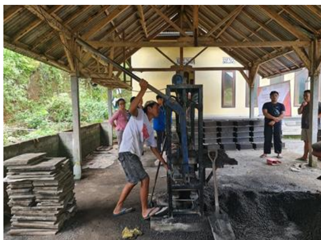
Gambar 4. Proses pencetakan batako

Dari gambaran data tersebut di atas, menunjukkan bahwa dengan adanya program kemitraan kepada masyarakat dari Universitas Warmadewa ini, perlahan-lahan kesulitan yang dialami mitra mulai dapat teratasi, dan menunjukkan adanya peningkatan produksi dan penjualan mulai dari awal tahun.