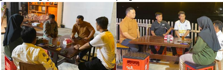
Gambar 1. Kegiatan Sosialisasi

Sosialisasi dilakukan sebagai tahap awal untuk memperkenalkan konsep Digital-Based Tourism serta manfaat digitalisasi bagi promosi wisata dan pengelolaan UMKM.