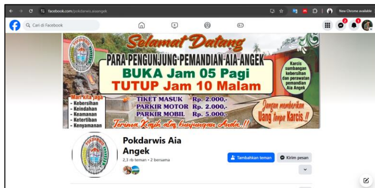
Gambar 3. Profil Facebook Pokdarwis Aia Angek