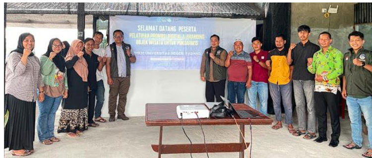
Gambar 2. Kegiatan Pelatihan Promosi Digital dan Branding Objek Wisata