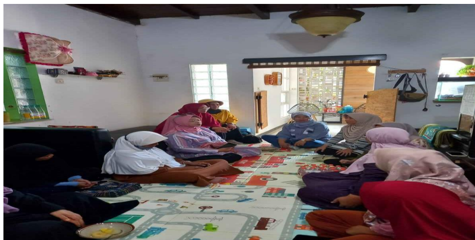
Gambar 3. Kegiatan PKM

Pelaksanaan Program Kemitraan Masyarakat (PKM) di Dasa Wisma "Dahlia" RT 05 RW 15 Desa Pakemitan Kidul Kecamatan Ciawi berjalan dengan baik dan mendapat antusiasme yang tinggi dari peserta. Secara umum, kegiatan yang dilaksanakan dalam tiga sesi ini menunjukkan adanya peningkatan pemahaman dan kemampuan peserta dalam mengelola serta mencatat keuangan rumah tangga secara sederhana dan sistematis. Pentingnya pengelolaan keuangan keluarga melalui penyuluhan manfaat pencatatan dan manajemen keuangan rumah tangga. Sebelum kegiatan, sebagian besar peserta belum memahami konsep pencatatan keuangan sebagai alat untuk mengevaluasi kondisi finansial keluarga. Hal ini konsisten dengan data dari Otoritas Jasa Keuangan (OJK, 2023) yang menyebutkan bahwa tingkat literasi keuangan masyarakat perdesaan masih rendah, hanya sebesar 38,03%, yang berdampak pada lemahnya pengelolaan keuangan di tingkat keluarga. Materi yang disampaikan pada sesi ini juga memperkuat temuan (Wijayanti et al.,