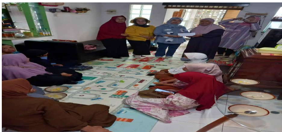
Gambar 2. Kegiatan PKM