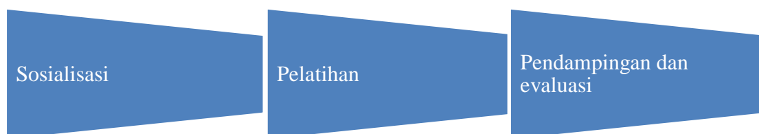
Gambar 2. Tahapan metode pengabdian

Kegiatan pengabdian masyarakat ini dilaksanakan dengan metode sosialisasi, pelatihan, penerapan teknologi, Pendampingan dan evaluasi serta keberlanjutan program. Tim terdiri dari 3 orang dosen, 4 Narasumber dan 3 orang mahasiswa yang dilibatkan sebagai pembantu pelaksana.