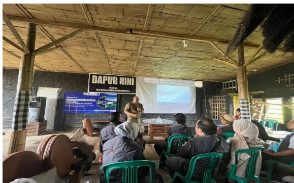
Gambar 4. Pelatihan Manajemen Desa Wisata Berkelanjutan

manajemen desa wisata. Kegiatan selanjutnya diadakan juga post test setelah penyampaian materi. Adapun berdasarkan hasil pretest dan post test, terjadi peningkatan pemahaman peserta menjadi 94.0% terkait konsep manajemen pengelolaan desa wisata yang efektif. Pada pelatihan manajemen pengelolaan desa wisata yang efektif ini tentunya memberikan manfaat nyata bagi Pokdarwis Desa Wisata Tambakmekar, selain meningkatkan kapasitas SDM, kegiatan ini menghasilkan rencana aksi yang berorientasi pada keberlanjutan.