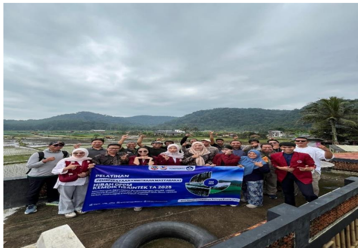
Gambar 3. Pelatihan Penyusunan Paket Wisata