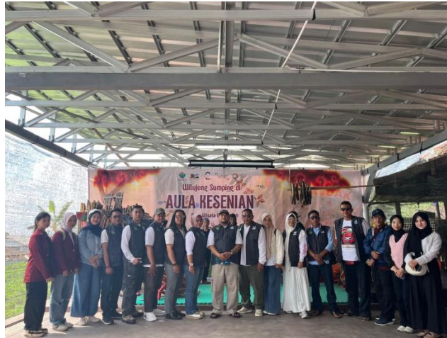
Gambar 7. Studi Banding ke Desa Wisata ALamendah

wisata, memperluas jaringan pemasaran, serta mendorong partisipasi masyarakat secara berkelanjutan.