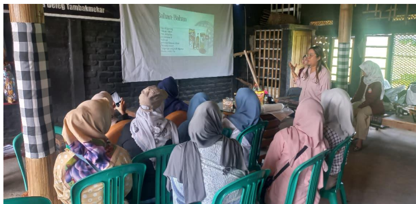
Gambar 6. Praktek Pembuatan Sabun Organik