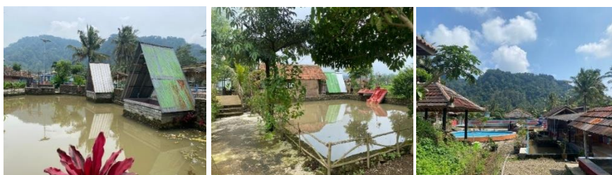
Gambar 1. Fasilitas penunjang Edu Agrowisata

Beberapa penelitian terdahulu menegaskan bahwa keberhasilan desa wisata sangat dipengaruhi oleh empat komponen utama pariwisata 4A ( Attraction, Amenity, Accesibility, dan Ancillary ). Selain itu, keterlibatan pemangku kepentingan ( pentahelix ) melalui kerjasama dengan pemerintah desa, akademisi, pelaku usaha, komunitas dan media juga menjadi kunci pengembangan destinasi wisata yang berkelanjutan. Oleh karena itu, penguatan kapasitas pokdarwis melalui pelatihan, pendampingan, transfer teknologi, serta pemanfaatan media digital perlu dilakukan agar desa wisata Tambakmekar mampu meningkatkan daya tarik dan daya saingnya.