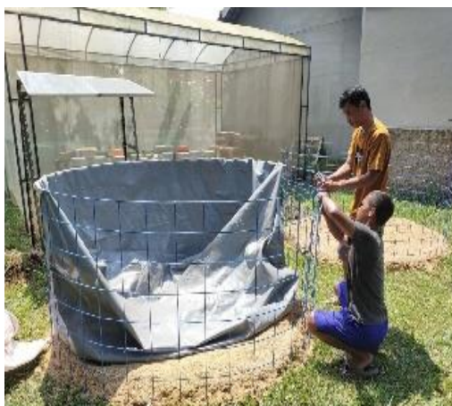
Gambar 4. Instalasi listrik dan kolam bioflok

Tim pelaksana bersama-sama dengan mitra melaksanakan instalasi listrik dan instalasi kolam bioflok ukuran diameter 2 meter tinggi 1,2 m sebanyak 3 buah Setelah kolam ikan terpasang selanjutnya untuk mempersiapkan kolam agar dapat tebar benih ikan nila, sebelumnya di isi air \pm 80-90 cm dan molase 100 ML/M 3 serta probiotik 10 ml/m 3 . Setelah didiamkan selama tiga hari, kolam bioflok yang sudah di isi air, molase dan probiotik selanjutnya aplikasi garam dolomit perikanan 100 gr/M 3 . Lalu didiamkan \pm 7-10 hari untuk menunggu bioflok tumbuh sebelum melakukan tebar benih ikan. Kolam bioflok menggunakan kolam berbentuk bundar karena dianggap lebih baik untuk kepadatan tebar benih yang tinggi karena kandungan oksigen di dalam air akan tersebar dengan lebih merata (Marisda & Anisa, 2020)