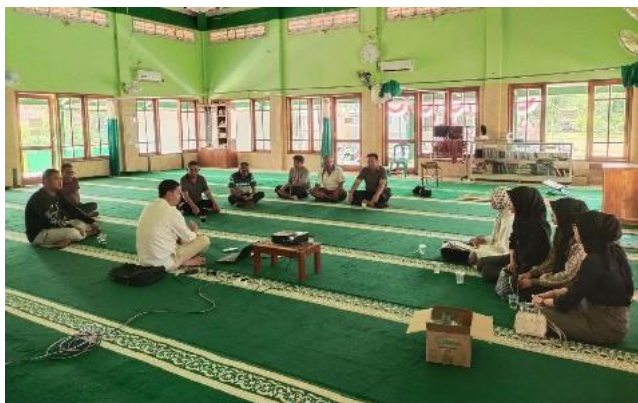
Gambar 3. Tim Memberikan pelatihan

Pada tahap ini tim pelaksana memberikan penyuluhan kepada mitra tentang bagaimana pentingnya pemenuhan kebutuhan gizi terutama protein, bagaimana memanfaatkan lahan nonproduktif menjadi lahan produktif dan bagaimana budidaya ikan nila dengan teknologi bioflok