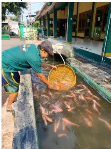
Gambar 2. Budidaya ikan nila secara tradisional

Selain itu, KMB Miftahul Huda telah melakukan kegiatan yang dapat membangun kemandirian pangan kebutuhan protein yaitu budidaya ikan nila secara tradisional dengan memanfaatkan kolam berukuran 1 m x 3 m yang dirasa belum optimal dalam memenuhi kebutuhan