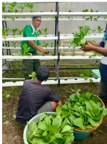
Gambar 1. Panen sayur hidroponik

Green house sayuran hidroponik yang dikelola KMB Miftahul Huda menjadi salah satu indikator kemandirian pangan karena dapat memenuhi kebutuhan anggota dan masyarakat sekitar, hal ini memberikan dampak yang baik terhadap anggota dan masyarakat. Sayuran hidroponik saat ini melakukan tanam dan panen berkelanjutan setiap satu bulan satu kali, anggota dan masyarakat sekitar dapat menikmati hasil panen sayuran hidroponik seperti pada gambar 1 yang memperlihatkan anggota KMB sedang melakukan panen sayur pakcoy.