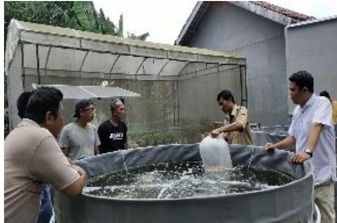
Gambar 5. Tebar benih ikan dan pakan

Pada tahap ini dilaksanakan tanggal 26 Agustus 2024, tim pelaksana dan mitra bersama-sama melakukan pengecekan kolam untuk melihat layak tidaknya melakukan tebar benih dengan indikator warna air menjadi berubah sedikit pekat yang menandakan bioflok tumbuh pada kolam, setelah melakukan pengecekan, selanjutnya tim pelaksana dan KMB melakukan tebar benih ikan sebanyak 8 kg (300 ekor)/ kolam. Setiap harinya ikan akan diberi pakan dengan takaran 5% /hari dari berat seluruh ikan dalam satu kolam. Dari hasil pantauan tim pelaksana dan mitra, dalam waktu 14 hari terjadi pertumbuhan signifikan berat ikan. Sebelumnya dari 37,5 ekor/kg menjadi 19 ekor/kg