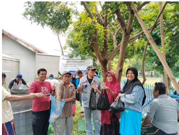
Gambar 8. Panen Ikan Nila Bioflok