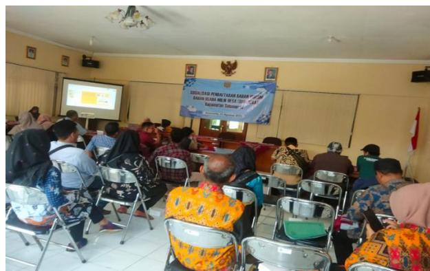
Gambar 1. Sosialisasi dan praktek pendaftaran badan hukum

Pelaksanaan PKM ini diawali dengan tahap persiapan, yaitu koordinasi bersama pemerintah desa dan pengurus BUMDes di Kecamatan Selomerto, Kabupaten Wonosobo. Pada tahap ini dilakukan identifikasi permasalahan utama yang dihadapi BUMDes, terutama terkait status legalitas badan hukum dan dalam pengelolaan laporan keuangan. Dari hasil diskusi dengan Pendamping Desa, Kasie Ekbang dan Kasie Pemer, tim PKM merumuskan rencana waktu pelaksanaan PKM dan disusun pula modul pelatihan.