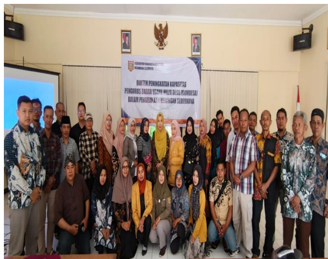
Gambar 4. Peserta Pelatihan Bersama tim PKM

Tahap akhir adalah evaluasi, yang dilakukan melalui diskusi dan tanya jawab dengan peserta. Dari hasil evaluasi, diketahui bahwa pelatihan ini memberikan manfaat signifikan bagi pengurus BUMDes. Mereka merasa lebih percaya diri dalam melakukan pendaftaran badan hukum serta memiliki keterampilan dasar untuk menyusun laporan keuangan. Namun, beberapa catatan penting yang muncul adalah masih perlunya pendampingan lanjutan agar pengurus dapat lebih terampil dalam menyusun laporan keuangan sesuai standar dan mampu menggunakan teknologi informasi untuk pencatatan.