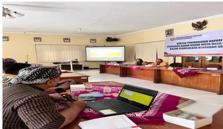
Gambar 3. Penyampaian Materi Bintek pengurus dalam pengelolaan keuangan (Penggunaan Aplikasi Komputurize)

Pada sesi kedua, pelatihan difokuskan pada pengelolaan laporan keuangan sederhana. Pengurus BUMDes dilatih Menggunakan Aplikasi Komputerize untuk Pembukuan Akuntansi dalam melakukan pencatatan transaksi harian, menyusun laporan laba rugi, serta membuat neraca sederhana. Kegiatan ini dilakukan dengan metode praktik langsung menggunakan contoh kasus usaha BUMDes. Hasilnya menunjukkan adanya peningkatan kemampuan pengurus dalam melakukan pencatatan keuangan. Sebelumnya, sebagian besar BUMDes hanya melakukan pencatatan secara manual dan tidak terstruktur, namun setelah pelatihan Menggunakan Aplikasi Komputerize untuk Pembukuan Akuntansi, pengurus mulai merasa lebih mudah dalam Penggunaannya dengan format sederhana yang lebih sistematis dan standar akuntansi.