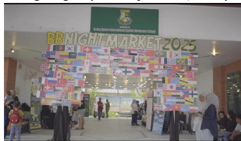
Gambar 1. Kegiatan Night Market di Brainy Bunch International Islamic School

Permasalahan ini tidak terkecuali dialami oleh siswa-siswi di Brainy Bunch International Islamic Montessori School, yang walaupun berada di lingkungan pendidikan Islam, tetap rentan terhadap krisis identitas, gaya hidup konsumtif, dan tekanan sosial. Salah satu aspek mendasar yang perlu diperkuat adalah pemahaman dan penghayatan terhadap ajaran agama Islam, yang tidak hanya sebatas ritual, tetapi menjadi pondasi nilai dalam pengambilan keputusan, membangun karakter, serta mengelola emosi dan relasi sosial (Syafuta et al., 2022). Lemahnya nilai-nilai spiritual di kalangan pelajar berdampak pada perilaku yang konsumtif, kurangnya kontrol diri, hingga rentan terhadap pengaruh negatif dari lingkungan (Mat Wajar et al., 2022).