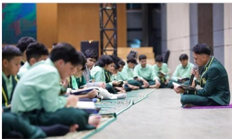
Gambar 2. Tilawah bersama siswa Brainy Bunch International Islamic School

Ayat ini menegaskan bahwa membina dan mendidik masyarakat, khususnya generasi muda, merupakan bagian dari dakwah dan pengabdian sosial yang mendatangkan keberuntungan di sisi Allah. Menyampaikan ilmu yang bermanfaat, membimbing remaja menuju kehidupan yang lebih terarah, dan menanamkan nilai-nilai Islam dalam keseharian merupakan bentuk implementasi nyata dari ajaran amar ma'ruf nahi munkar.