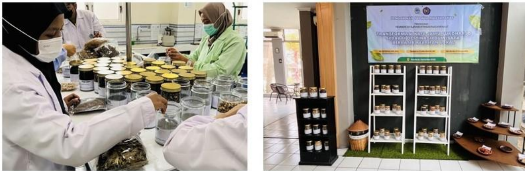
Gambar 3. Pojok herbarium

Dalam mendukung transformasi Kafe Jamu Sukoharjo sebagai destinasi eduwisata, dalam Kafe Jamu diberikan media pembelajaran yang berupa papan informasi yang berisi informasi terkait tanaman yang berpotensi obat. Dalam papan informasi berisi informasi tentang tanaman yang berpotensi sebagai obat baik yang telah digunakan secara empiris, maupun telah terbukti secara ilmiah. Informasi tersebut berupa foto tanaman obat, nama tanaman obat, nama ilmiah tanaman obat, nama daerah, bagian berkhasiat, serta kegunaan dan khasiat dari obat. Dengan adanya papan informasi terkait obat ini diharapkan dapat saling melengkapi dengan herbarium yang disediakan.