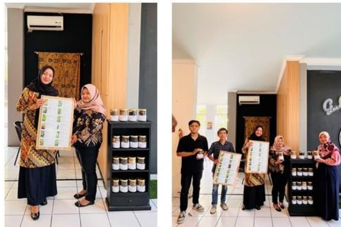
Gambar 4. Penyerahan Papan informasi Tanaman Obat

Dalam mendukung transformasi Kafe Jamu Sukoharjo sebagai destinasi eduwisata, dalam Kafe Jamu diberikan media pembelajaran yang berupa papan informasi yang berisi informasi terkait tanaman yang berpotensi obat. Dalam papan informasi berisi informasi tentang tanaman yang berpotensi sebagai obat baik yang telah digunakan secara empiris, maupun telah terbukti secara ilmiah. Informasi tersebut berupa foto tanaman obat, nama tanaman obat, nama ilmiah tanaman obat, nama daerah, bagian berkhasiat, serta kegunaan dan khasiat dari obat. Dengan adanya papan informasi terkait obat ini diharapkan dapat saling melengkapi dengan herbarium yang disediakan.