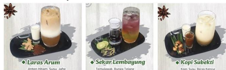
Gambar 7. Perbaikan menu di Kafe Jamu

Saat ini Kafe Jamu Sukoharjo sedang terus melakukan perbaikan dalam hal pengelolaan Kafe Jamu. Diantaranya adalah memperbaiki Menu di Kafe Jamu, dengan memperbaiki menu di Kafe Jamu menjadi menu-menu yang kekinian, dengan tampilan yang estetik. Berikut beberapa contoh menu terbaru di Kafe Jamu Sukoharjo :