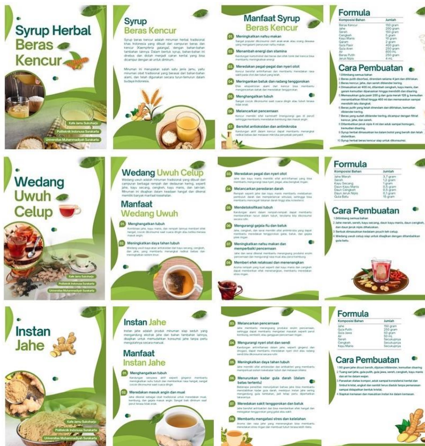
Gambar 2. Booklet Workshop di Kafe Jamu Sukoharjo

Kegiatan pengabdian ini dilakukan dengan membantu Kafe Jamu Sukoharjo dalam menyusun materi untuk workshop bagi pengunjung yang ingin belajar tentang cara pembuatan jamu. Dalam kegiatan tersebut, tersusun 3 booklet workshop bagi pengunjung Kafe Jamu Sukoharjo. Booklet tersebut adalah workshop pembuatan instan jahe, syrup beras kencur dan wedang uwuh celup.