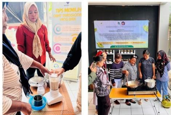
Gambar 6. Kegiatan workshop di Kafe Jamu

Kegiatan workshop sesi pertama telah dilakukan untuk pengunjung di Kafe Jamu Sukoharjo. Dalam kegiatan workshop diikuti oleh 12 peserta dengan materi workshop pembuatan syrup beras kencur dan instan jahe. Kegiatan workshop ini diikuti oleh peserta dengan sangat antusias. Dari kegiatan workshop ini, peserta dapat mengetahui cara pembuatan dan mampu membuat syrup beras kencur dan instan jahe.