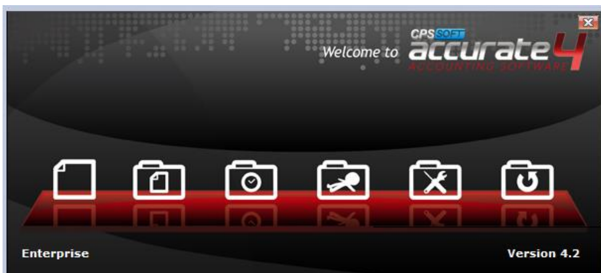
Gambar 1.1 Aplikasi Accurate Vers. 4.0

Menurut (Ratri Hidayati Varinov & Primanita Setyono, 2025), integrasi fitur Accurate Online meningkatkan konsistensi data antar departemen sehingga pelaporan keuangan dapat disajikan secara real-time dan akurat. Studi lain menurut (Petra et al., 2024) menunjukkan bahwa