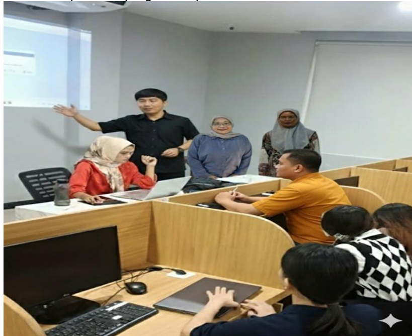
Gambar 1.3 Penjelasan penggunaan accurate

bimbingan belajar makarios sebagai peserta yang beralamat di Jl. Sehati No.15 A, Tegal Rejo, Kec. Medan Perjuangan, Kota Medan, Sumatera Utara 20237 dilaksanakan tanggal 25 september 2025 mulai pukul 13.00 WIB sampai selesai. Peserta dalam kegiatan ini sebanyak 15 orang. Pada sesi pertama, Tim pengabdian memaparkan materi tentang pembuatan laporan keuangan yang baik serta siklus akuntansi kemudian pengenalan tentang aplikasi accurate yang digunakan dalam pembuatan laporan keuangan. Setelah dilakukan pendampingan penggunaan aplikasi accurate didampingi tim sosialisasi. Untuk pendampingan selanjutnya tim sosialisasi mempresentasikan laporan yang telah dibuat di depan karyawan makarios. Kemudian sesi di tutup dengan tanya jawab pada para peserta yang belum paham terhadap materi yang di sampaikan.