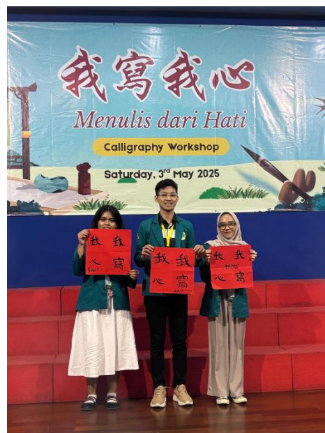
Gambar 6, Hasil Tulisan Mahasiswa