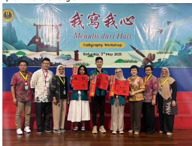
Gambar 7, Pemenang Lomba

Melalui kegiatan ini, mahasiswa tidak hanya berlatih menyalin aksara Mandarin dengan teknik yang tepat, tetapi juga mengasah konsentrasi, kesabaran, serta apresiasi terhadap nilai seni dan budaya Tiongkok. Proses menulis kaligrafi membantu mereka mengekspresikan perasaan sekaligus memperkuat keterampilan menulis kaligrafi.