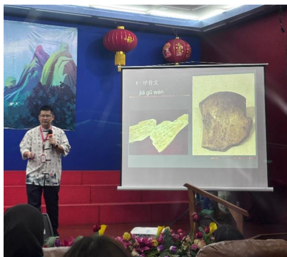
Gambar 1, Sejarah Karakter Han

filosofi yang dimiliki oleh sang kaligrafer. Dengan demikian, seni kaligrafi dapat pula dipandang sebagai cerminan kepribadian dan keadaan batin seseorang.