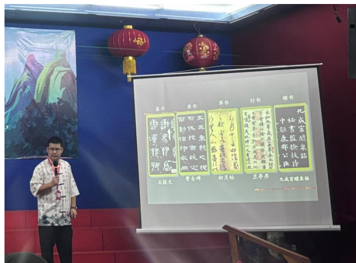
Gambar 3, Jenis Tulisan

Dalam seni kaligrafi Tiongkok, terdapat berbagai teknik dan gaya penulisan yang telah berkembang sejak ribuan tahun lalu. Masing-masing gaya memiliki ciri khas tersendiri, baik dalam bentuk guratan, struktur huruf, maupun ekspresi artistik. Memahami teknik dan gaya ini sangat penting untuk menguasai dasar-dasar kaligrafi serta mengapresiasi nilai estetikanya.