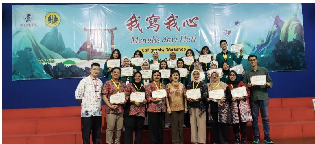
Gambar 8, Pembagian Sertifikat Peserta

Pada akhir kegiatan ini, pihak penyelenggara yaitu Indonesia Calligraphy and Painting Institute Jakarta memberikan hadiah kepada tiga mahasiswa Prodi Pendidikan Bahasa Mandarin Universitas Negeri Jakarta. Hadiah tersebut merupakan simbol dari hasil belajar yang telah mereka peroleh selama mengikuti kegiatan pelatihan menulis kaligrafi tersebut. Panitia melihat selama proses pelatihan, pendampingan serta hasil akhir dari tulisan ketiga mahasiswa tersebut.