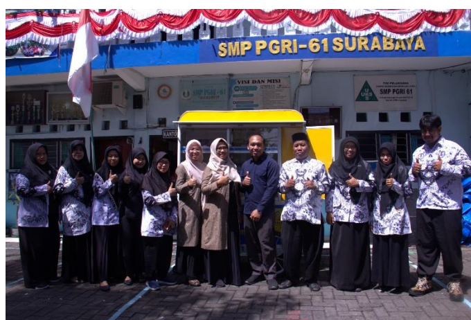
Gambar 7. Dokumentasi Penyerahan Gerobak Literasi

Kegiatan ini diakhiri dengan penyerahan satu unit Gerobak Literasi dan 100 buku bacaan kepada kepala SMP PGRI 61 Surabaya oleh ketua pelaksana pengabdian dan foto bersama. Dokumentasi penyerahan Gerobak Literasi ditunjukkan pada Gambar 5 berikut.