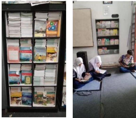
Gambar 2. Pojok Baca di SMP PGRI 61 Surabaya

Gerobak literasi adalah sebuah perpustakaan keliling yang ditempatkan di lingkungan sekolah dan dapat diakses oleh seluruh warga SMP PGRI 61 Surabaya.