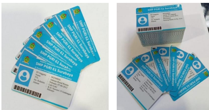
Gambar 6. Kartu Anggota

Gerobak Literasi yang dikembangkan terhubung dengan aplikasi perpustakaan digital, Si Perpustakaan. Seluruh warga sekolah, baik guru maupun siswa yang berjumlah 80 siswa diberikan kartu anggota untuk memudahkan proses peminjaman dan pengembalian buku. Dengan adanya aplikasi perpustakaan digital ini siswa dan guru yang ingin meminjam buku cukup me-scan barcode yang ada di belakang buku dan me-scan barcode kartu anggota. Kartu anggota ditunjukkan pada Gambar 6 berikut.