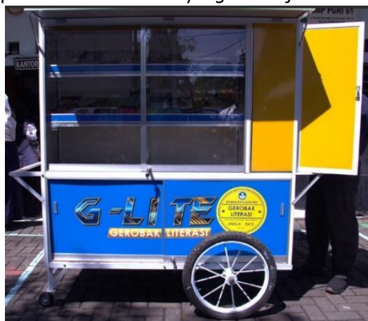
Gambar 4. Tampilan Gerobak Literasi

Gambar 4 adalah tampilan Gerobak Literasi yang sudah jadi.