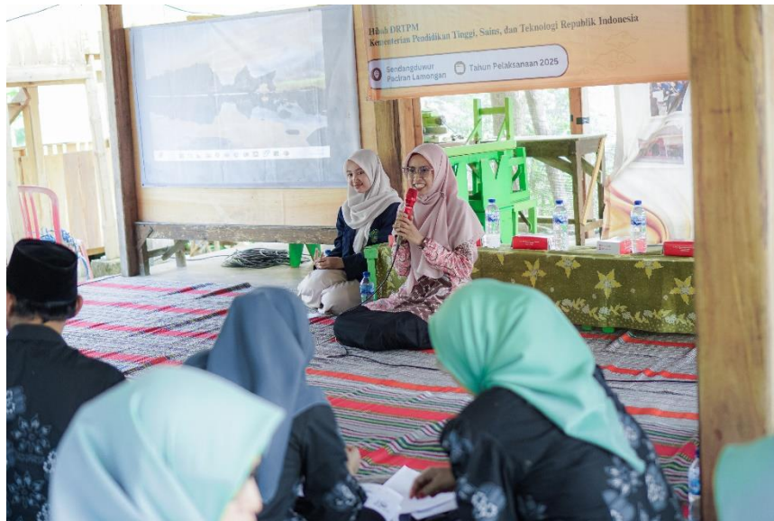
Gambar 4. Pemaporan Materi dan Pelatihan oleh Tim Pengabdian

strategi pemasaran digital. Strategi pemasaran digital yang dapat dilakukan ialah dengan dengan membangun branding wisata Desa Sendangduwur menjadi citra wisata berkearifan lokal yang didalamnya memuat wisata religi, edukasi, budaya, alam, dan kuliner.