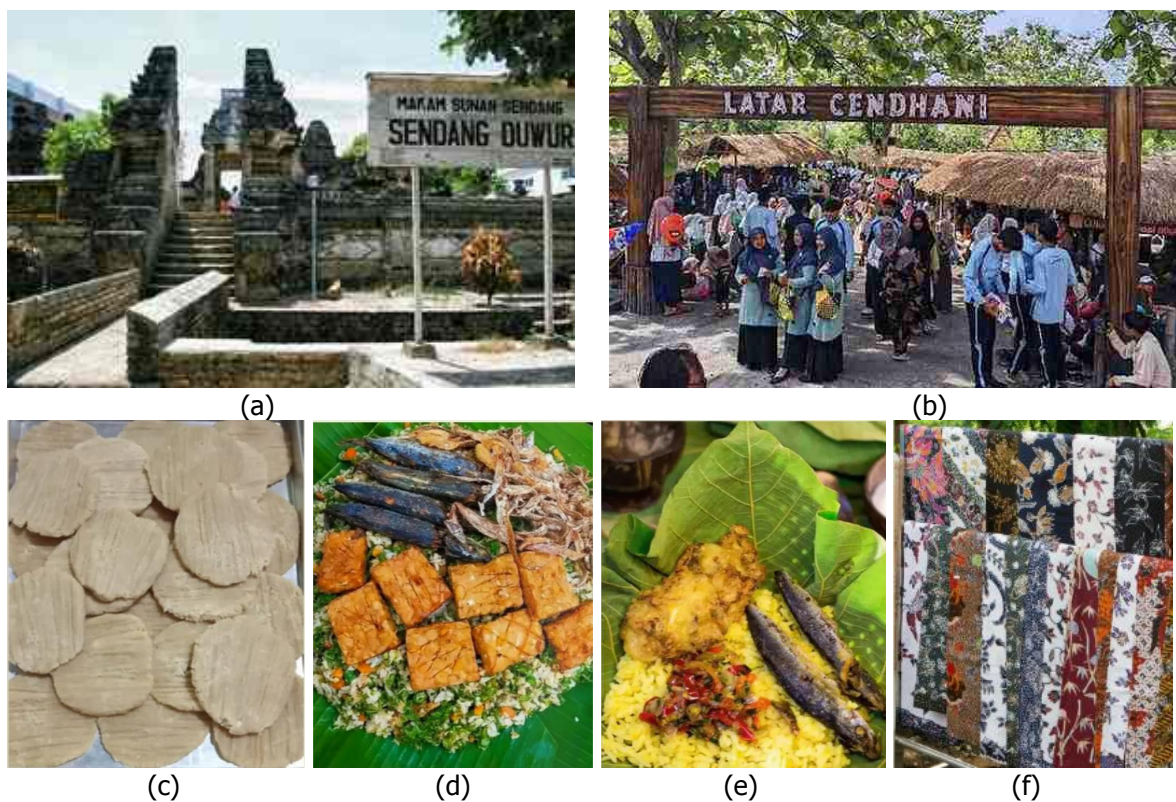
Gambar 3. (a) Makam Sunan Sendang Duwur (b) Latar Cendhani (c) Kue Sor Bebek (d) Nasi Langgi (e) Nasi Muduk (f) Batik Sendang Duwur

Dimana potensi-potensi wisata yang dimiliki dapat dimaksimalkan dalam industri kreatif desa Sendangduwur Lamongan. Dalam pengembangan ini membutuhkan sinergi antara Pokdarwis, BUMDes, serta Pemerintah Desa. Strategi pemasaran yang dilakukan sudah dilakukan dengan offline maupun online. Zaman yang serba digital yang menuntut kita dapat beradaptasi dan dapat memanfaatkan platform digital dengan maksimal. Dimana jika kita dapat memanfaatkannya dengan maksimal maka jangkauan pemasaran akan lebih luas mengingat seluruh masyarakat telah menggunakan media digital, tidak hanya lokal tetapi global.