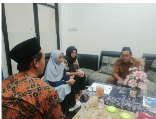
Gambar 2. Koordinasi awal dengan perangkat Desa Sendangduwur

Pengabdian kepada masyarakat ini diawali dengan survey awal dan observasi. Tim pengabdian melakukan kegiatan survei lokasi ke objek kegiatan pengabdian yaitu Desa Sendangduwur yang terletak di Kecamatan Paciran, Kabupaten Lamongan. Tim pengabdian juga melakukan wawancara dan diskusi dengan pengurus Desa Sendangduwur dan juga perwakilan Pokdarwis Desa untuk memetakan dan mengidentifikasi situasi dan permasalahan yang menjadi kendala pengembangan wisata di Desa Sendangduwur yang bisa dilihat pada Gambar 1. Ditemukan bahwa kurangnya pengembangan wisata dan industri kreatif, serta strategi pemasaran menjadi salah satu faktor penyebabnya sehingga dibutuhkan pelatihan mengenai pengembangan wisata dan industri kreatif, serta strategi pemasaran untuk mendukung pengembangan potensi wisata yang ada di Desa Sendangduwur.