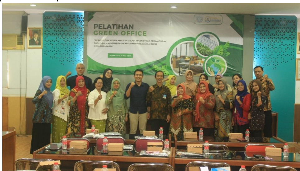
Gambar 2. Foto tim pengabdian Bersama peserta pelatihan

kelompok guru juga dibimbing untuk menyusun rencana aksi sederhana tentang langkah-langkah implementasi green office di lingkungan sekolah masing-masing, serta strategi penyampaian materi kepada siswa.