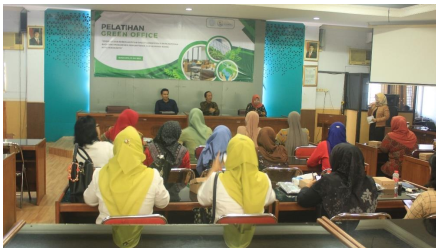
Gambar 1. Foto pelaksanaan kegiatan pengabdian

Pada sesi ini narasumber melibatkan diskusi dua arah untuk memancing pemahaman peserta dengan memberikan studi kasus yang relevan. Peserta juga dibagi menjadi kelompok untuk menganalisis studi kasus terkait tantangan dan peluang implementasi green office di lingkungan kerja nyata. Hasil diskusi akan dipresentasikan dan dibahas bersama. Setiap peserta atau kelompok akan didorong untuk menyusun rencana aksi pribadi atau unit kerja sederhana tentang langkah-langkah implementasi green office yang dapat mereka terapkan segera setelah pelatihan. Pada akhir pelatihan, narasumber memberikan sesi khusus untuk membahas bagaimana materi green office dapat diintegrasikan ke dalam mata pelajaran administrasi perkantoran yang sudah ada, baik melalui pengembangan modul, RPP, maupun kegiatan ekstrakurikuler. Peserta akan didorong untuk berbagi ide dan tantangan. Setiap