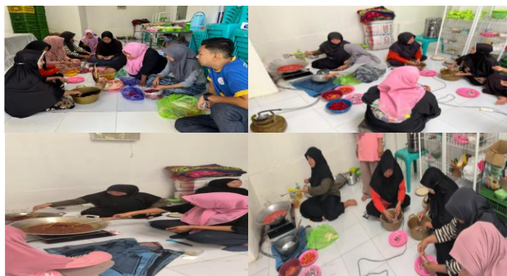
Gambar 2 Proses Pelatihan

Selain dari proses produksi yang harus diperhatikan, penyimpanan dan pengemasan juga merupakan hal yang tidak kalah penting. Karena produk yang dikemas dengan baik tidak hanya berfungsi untuk memberi perlindungan produk dari kerusakan, tetapi menjadi daya tarik dalam pemasaran. Pengemasan yang baik tidak hanya berfungsi untuk melindungi produk dari kerusakan, tetapi juga dapat menjadi alat pemasaran yang efektif. Kotler & Keller (2019) menjelaskan bahwa desain kemasan yang menarik dapat meningkatkan pengenalan merek dan memberikan nilai tambah bagi konsumen. Putri & Hidayat (2020) juga menambahkan bahwa inovasi kemasan ramah lingkungan dapat meningkatkan daya saing produk, karena konsumen semakin peduli terhadap keberlanjutan dan dampak lingkungan dari produk yang mereka beli. Dokumentasi pelaksanaan pelatihan dapat dilihat pada gambar 2.