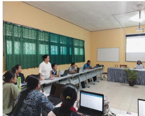
Gambar 2. Pembina OSIS