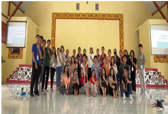
Gambar 1. Pengurus OSIS

Hasil evaluasi lainnya dari kegiatan pelatihan kepemimpinan bagi Pembina dan pengurus OSIS SMA Santa Maria Nanga Pinoh, Kalimantan Barat ini diperoleh melalui wawancara dengan peserta pelatihan. Pembina OSIS merasa lebih siap melaksanakan tugas mendampingi pengurus OSIS dan memfasilitasi program kerja yang inovatif. Pengurus OSIS menunjukkan peningkatan dalam hal kepercayaan diri, kemampuan berkomunikasi, dan bekerjasama dalam tim.