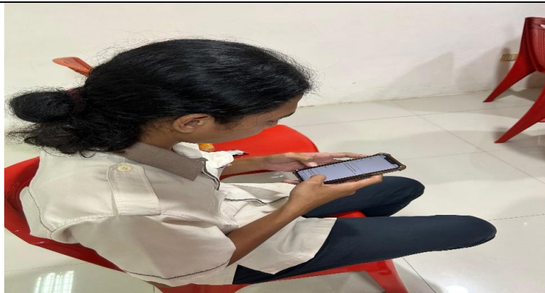
Gambar 2. Pengisian Pre-Test dan Post-Test

Hasil analisis pre-test dan post-test menunjukkan bahwa pemahaman peserta dan kemampuan mereka dalam penerapan digital marketing dan pembuatan laporan keuangan berbasis SAK Entitas Privat meningkat secara signifikan. Peningkatan ini terlihat dalam pengetahuan konseptual dan keterampilan praktis peserta, serta kepercayaan diri mereka dalam mengimplementasikan materi yang diberikan.