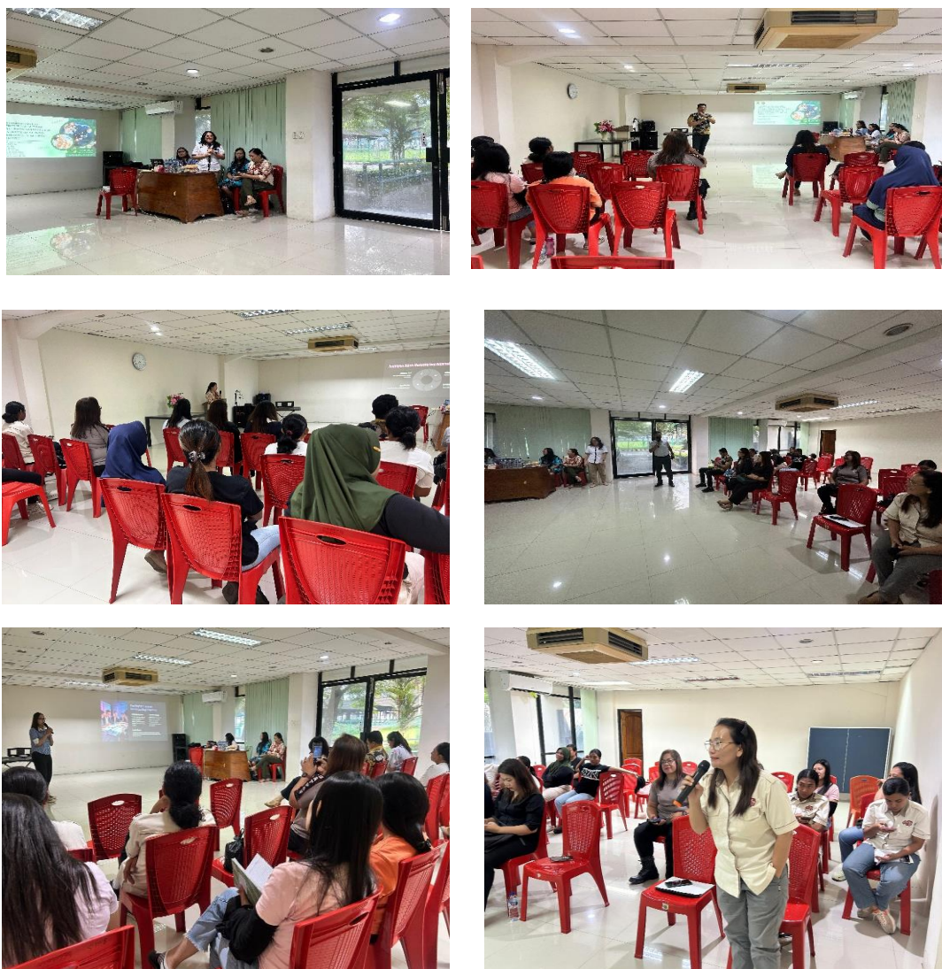
Gambar 1. Ceramah Interaktif

Selain itu, materi ceramah juga berfokus pada pentingnya menggunakan marketing digital untuk mengembangkan usaha koperasi di era modern. Peserta diajarkan tentang berbagai teknik pemasaran digital untuk meningkatkan daya saing koperasi dan memperluas jangkauan pasar melalui penggunaan marketplace, website, dan media sosial. Di era teknologi informasi saat ini, kemampuan koperasi untuk menggunakan pemasaran digital menjadi kunci untuk menghadapi tantangan persaingan usaha. Sebuah penelitian yang dilakukan oleh (Hotmaria; & Rakhman, 2024; Susanti et al., 2025) menemukan bahwa pemasaran digital memainkan peran penting dalam meningkatkan visibilitas produk, memperluas pasar, dan meningkatkan pendapatan koperasi. Namun, pengurus koperasi masih kekurangan literasi digital.