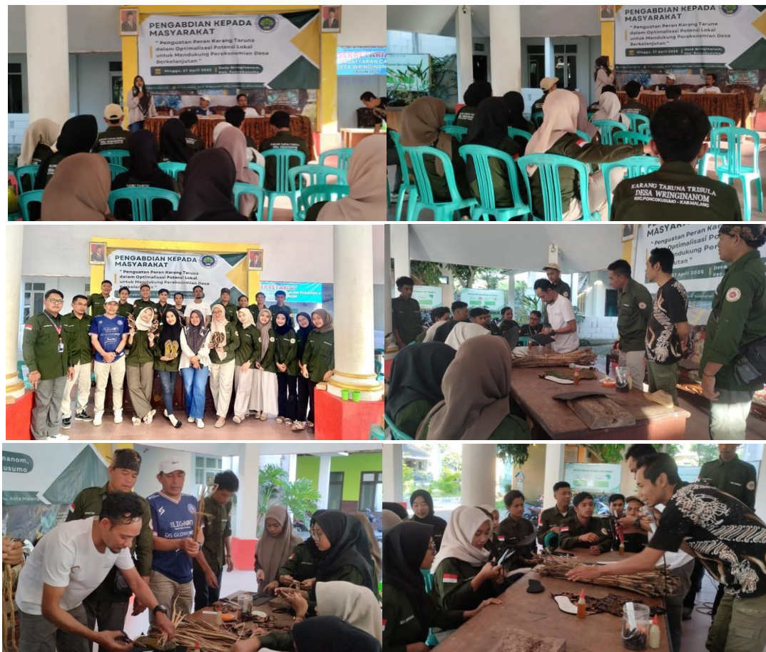
Gambar 1. Kegiatan Pengabdian kepada Anggota Karang Taruna

Keberhasilan target jumlah peserta pendampingan sesuai dengan rencana yakni 30 orang. Dengan demikian dapat dikatakan bahwa target peserta pendampingan ini tercapai 100%. Angka tersebut menunjukkan bahwa kegiatan pengabdian ini berhasil dan ketercapaian tujuan pendampingan secara umum telah tercapai.