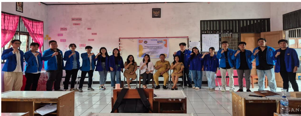
Gambar 2. Foto bersama sebelum kegiatan dimulai

Pengabdian pada masyarakat di SMKN 2 Tondano dilaksanakan melalui ceramah, diskusi interaktif antara pemateri dengan para siswa. Pada bagian literasi kewirausahaan diberikan materi tentang perencanaan, pengantar kewirausahaan, usaha dengan business model canvas (BMC) serta mengangkat wirausaha kuliner dari produk local. Pada bagian literasi keuangan diberikan materi tentang keterampilan membuat anggaran, menabung, mengelola utang, dan mengambil keputusan keuangan, serta investasi di era gen Z.