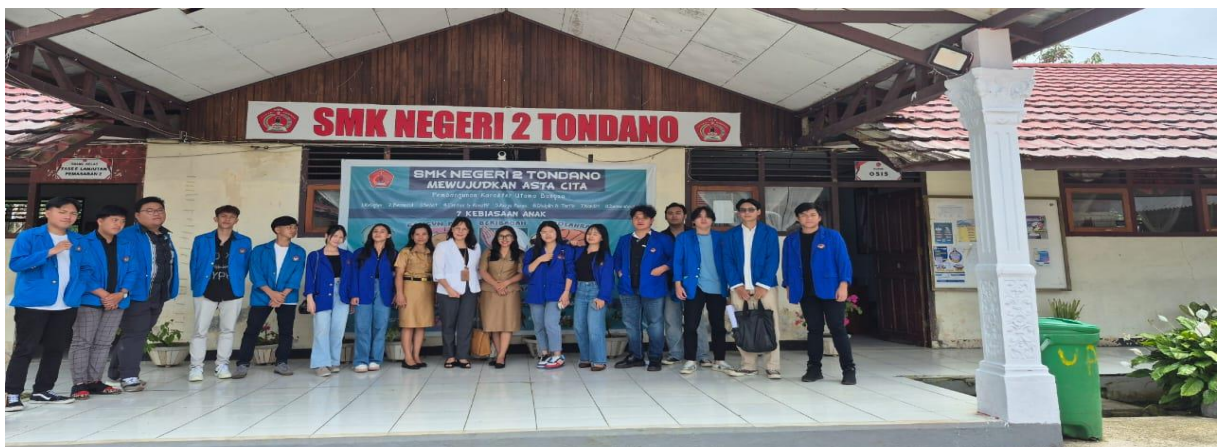
Gambar 1. Foto bersama di depan sekolah

Sekolah menengah kejuruan negeri 2 (SMKN 2) Tondano adalah sekolah vokasi yang terkenal di Kota Tondano, Kabupaten Minahasa Provinsi Sulawesi Utara. SMKN 2 Tondano memiliki visi "Terwujudnya lulusan yang mandiri, kompeten dan bersertifikat keahlian".