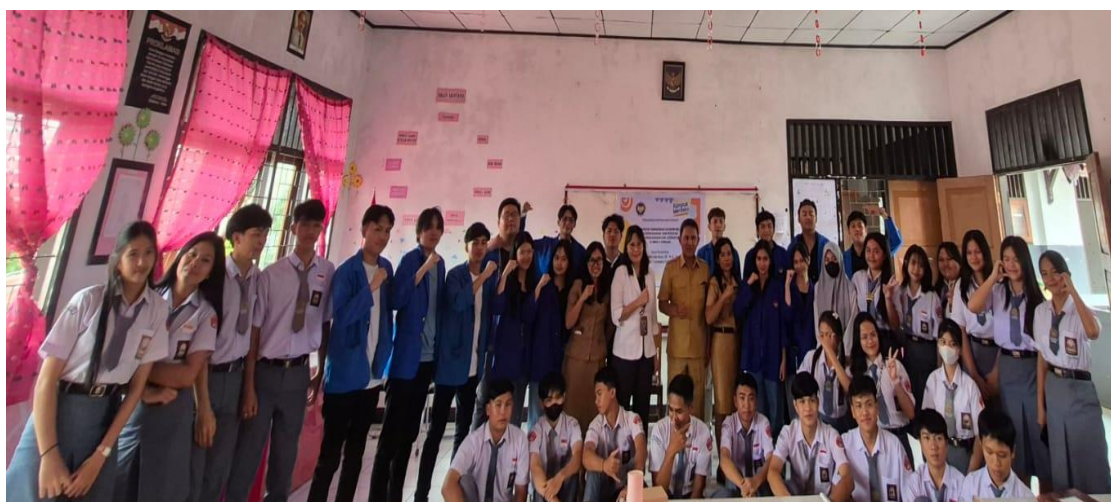
Gambar 5. Foto bersama peserta, guru-guru dan pemateri

menumbuhkan sikap kemandirian dan kreativitas. Melalui penguatan literasi kewirausahaan memberikan dampak bagi siswa antara lain siswa memahami prinsip-prinsip bisnis, mulai dari perencanaan hingga pengelolaan, dan mengembangkan kemampuan untuk menciptakan produk atau jasa yang inovatif, siswa dapat belajar mengevaluasi risiko secara objektif dan menyiapkan strategi untuk mengatasinya, sehingga dapat mengurangi potensi kegagalan. Literasi kewirausahaan juga dapat menumbuhkan karakter positif seperti kemandirian, kreativitas, dan jiwa besar, yang penting untuk menjadi wirausaha yang sukses serta siswa dapat belajar mengidentifikasi peluang usaha yang ada di sekitar mereka dan mengembangkan ide-ide bisnis yang inovatif.