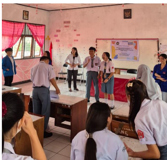
Gambar 3. Pelaksanaan kegiatan

Pengabdian pada masyarakat di SMKN 2 Tondano dilaksanakan melalui ceramah, diskusi interaktif antara pemateri dengan para siswa. Pada bagian literasi kewirausahaan diberikan materi tentang perencanaan, pengantar kewirausahaan, usaha dengan business model canvas (BMC) serta mengangkat wirausaha kuliner dari produk local. Pada bagian literasi keuangan diberikan materi tentang keterampilan membuat anggaran, menabung, mengelola utang, dan mengambil keputusan keuangan, serta investasi di era gen Z.