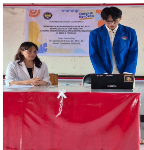
Gambar 4. Menyajikan materi kewirausahaan

Materi mengenai literasi keuangan membantu siswa lebih memahami konsep keuangan sehingga dapat mengelola keuangan dengan bijak serta terhindar dari masalah keuangan. Literasi keuangan memberikan penguatan kepada siswa SMK untuk membuat keputusan yang tepat, menabung, mengelola pinjaman serta berinvestasi dengan tepat. Secara lebih spesifik materi yang diberikan membantu siswa SMK memahami konsep dasar pengelolaan keuangan seperti membuat anggaran, menabung, dan berinvestasi. Literasi keuangan membantu menghindari perilaku konsumtif, utang, dan masalah keuangan lainnya serta memahami pentingnya investasi dan pengelolaan keuangan pribadi untuk mencapai tujuan finansial di masa depan. Dengan literasi keuangan SMK dapat belajar memahami berbagai produk dan layanan keuangan yang tersedia, seperti kartu kredit, asuransi, dan pinjaman serta membedakan kebutuhan dan keinginan, serta membuat keputusan belanja yang lebih bijak.