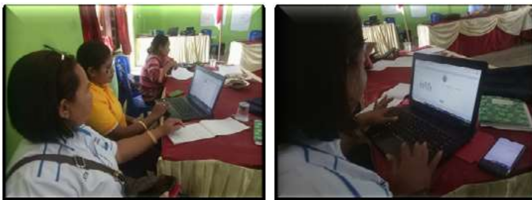
Gambar 4. Pendampingan Pendaftaran BUMDes Mafutnek secara Online