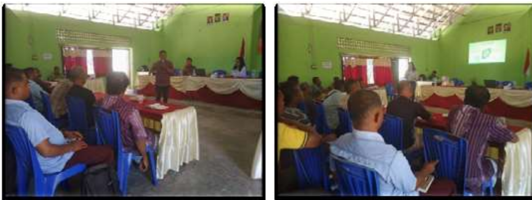
Gambar 3. Sesi Penyampaian Materi

Kegiatan dilaksanakan selama dua hari, dimana pada hari pertama dan kedua materi dibagi dalam dua sesi (Gambar 3). Sedangkan untuk pendampingan (Gambar 4) pendaftaran BUMDes secara online dilakukan pada hari terakhir. Untuk melihat ketercapaian indikator dalam pelaksanaan kegiatan dilakukan pre-test dan post test kemudian dianalisis ketercapaian dari masing-masing indikator (Baunsele et al., 2023). Untuk ketercapaian indikator tiga ukur berdasarkan dokumen yang dihasilkan.