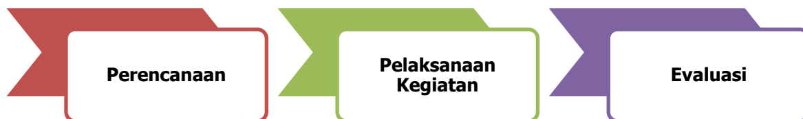
Gambar 2. Tahapan pelaksanaan pengabdian

Pada tahap perencanaan Tim merancang kegiatan berdasarkan masalah yang ada di desa Tunbaun. Selanjutnya pada tahap pelaksanaan kegiatan, tim melaksanakan kegiatan berupa pelatihan yang dilakukan dengan menggunakan metode ceramah dan diskusi serta dilanjutkan dengan praktek/pendampingan pendaftaran BUMDes. Evaluasi dilakukan dengan menggunakan pre-test dan post tests untuk melihat ketercapaian indikator.