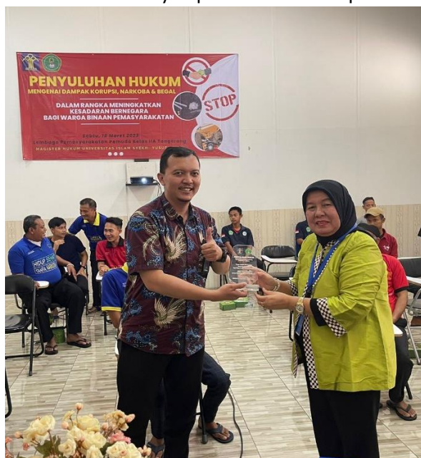
Gambar 3. Pemberian cinderamata

Adapun pertanyaan-pertanyaan selama pengabdian kepada masyarakat berlangsung diantara lain sebagai berikut: