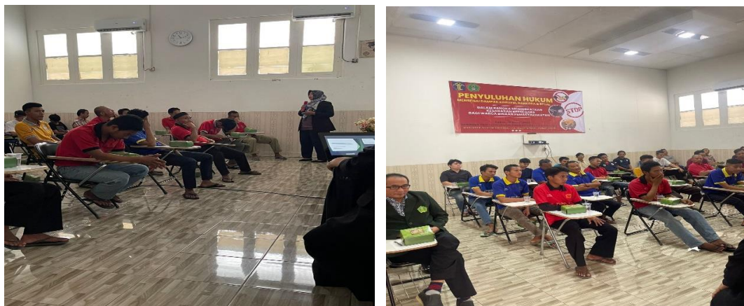
Gambar 2. Penyampaian materi oleh pemateri

Selama diskusi berlangsung pada kegiatan menggunakan metode interaktif antara peserta dengan pemateri. Diskusi dilakukan dengan pertama kali pemaparan materi dari pemateri kegiatan pengabdian kepada masyarakat. Setelah pemaparan materi selesai lalu tahap tanya jawab antara peserta dengan pemateri. Dengan adanya diskusi tanya jawab diharapkan dapat memberikan penjelasan dan pemahaman tentang pertanyaan yang diajukan oleh peserta kepada pemateri.