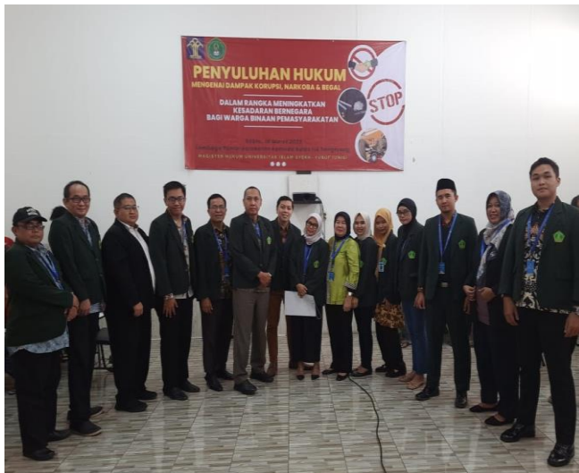
Gambar 2. Peserta dan Tim pengabdian kepada masyarakat