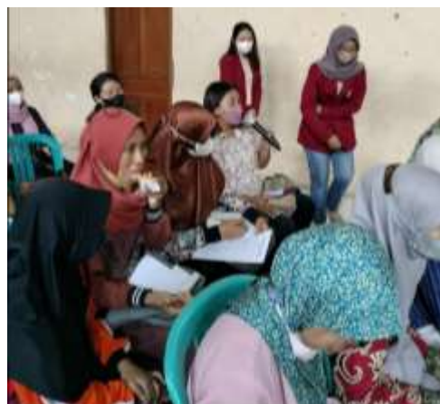
Gambar 3. Sesi Diskusi