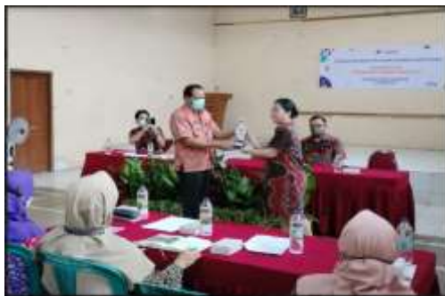
Gambar 1. Pembukaan Sosialisasi

Sebelum pemaparan materi, peserta diminta untuk mengisi pre-test guna mengukur pemahaman mengenai pencatatan akuntansi. Hasil tersebut akan dibandingkan dengan hasil post test. Tahap ini dilakukan untuk mengetahui apakah terdapat peningkatan pemahaman setelah dilakukannya sosialisasi. Pada tahap pemaparan materi, narasumber melakukan penyampaian materi dengan metode interaktif dengan peserta. Pemateri dalam seminar keuangan ini terdiri dari 4 pemateri. Pemateri pertama membahas mengenai pentingnya kartu persediaan dan bagaimana membuat dan mengisi kartu persediaan. Pemateri kedua membahas mengenai pentingnya kartu aset dan bagaimana mengisi kartu aset berdasarkan pembicaraan materi sebelumnya. Pemateri ketiga membahas mengenai pentingnya penentuan komponen-komponen penyusun laporan arus kas. Sedangkan pemateri keempat membahas mengenai cara menyusun laporan arus kas dengan metode tidak langsung bagi UMKM secara sederhana. Berikut aktivitas yang dilakukan: