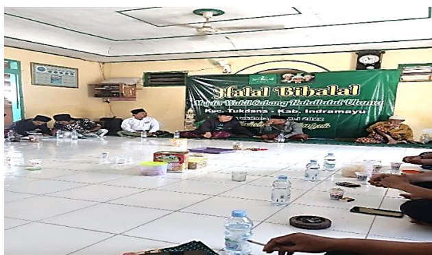
Gambar 5. Kegiatan peringatan hari besar Islam (PHBI)

"Iya memang... Secara umum, orang melakukan kegiatan PHBI seperti peringatan maulid Nabi Muhammad SAW, Isra' Mi'raj, dan Nuzulul Qur'an dan lainnya itu dilakukan dengan melibatkan masyarakat secara umum secara luas tidak hanya dari Desa sendiri saja melainkan dari Desa tetangga. Kegiatan ini bertujuan untuk menanamkan keteladanan bagi masyarakat dan diharapkan dapat menjalin silaturahmi secara umum dan bahkan menarik orang-orang yang masih abangan untuk menjadi santri putihan di masa depan".