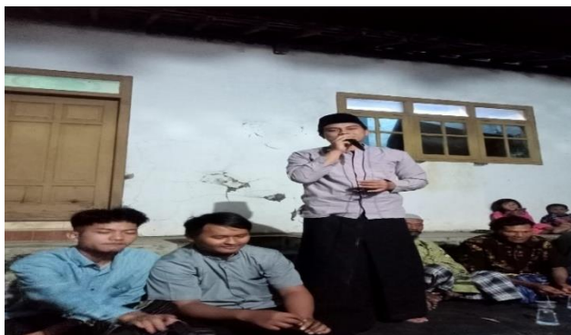
Gambar 4. Kegiatan majelis ta'lim sholawat dan maulid

"Acara kegiatan Maulid Nabi Muhammad SAW dan shalawat rutin setiap Jum'at malam Sabtu merupakan salah satu program kegiatan rutin yang selalu dilakukan dalam upaya melestarikan nilai-nilai keagamaan yang diwariskan oleh para auliya' salaf kami khususnya di Desa Tukdana ini. Adapun kegiatan ini pula merupakan salah satu penopang pada kegiatan inti selapan/bulanan".