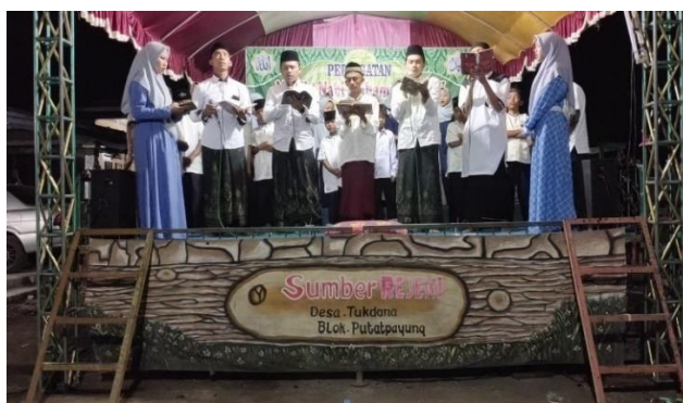
Gambar 3. Kegiatan bulanan maulid dan sholawat

"Kegiatan rutin bagi sepeuh masyarakat dan para remaja putra maupun remaja putri salah satu bentuk penopang keberlangsungan majelis ta'lim Nahdlatul Ulama ialah adanya berbagai kegiatan rutin mingguan yang dilakukan oleh para jama'ah dan para santri, seperti halnya rutin yasin dan tahlil. Kegiatan ini sangat dapat menjalin kekompakan dan silaturahmi bagi jama'ah dan masyarakat pada umumnya. Hal ini juga sebagai wadah buat masyarakat yang membutuhkan bantuan untuk membacakan do'a yasin dan tahlil bagi masyarakat yang keluarganya sudah meninggal. Selain itu pula kegiatan ini juga menjadi barometer keseriusan dan kesuksesan pada majelis ta'lim Nahdlatul Ulama".