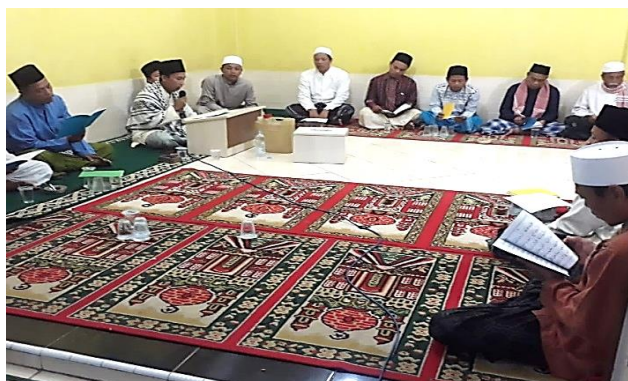
Gambar 2. Kegiatan kajian kitab kuning dan tausiyah