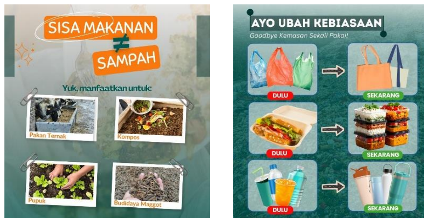
Gambar 1. Materi Edukasi

Tahap pemilahan sampah dilaksanakan melalui kegiatan penyuluhan dan diskusi interaktif mengenai jenis-jenis sampah, pentingnya pemilahan sampah sejak dari sumbernya, serta dampak lingkungan akibat pengelolaan sampah yang tidak tepat. Edukasi disampaikan secara langsung dengan bahasa yang komunikatif dan disesuaikan dengan kondisi sosial budaya masyarakat setempat. Tahap pendampingan dilakukan dengan memberikan contoh dan praktik langsung pemilahan sampah rumah tangga, khususnya pemisahan antara sampah organik dan anorganik. Pada tahap ini, masyarakat didorong untuk mempraktikkan pemilahan sampah di rumah masing-masing dengan pendampingan tim pengabdian masyarakat.