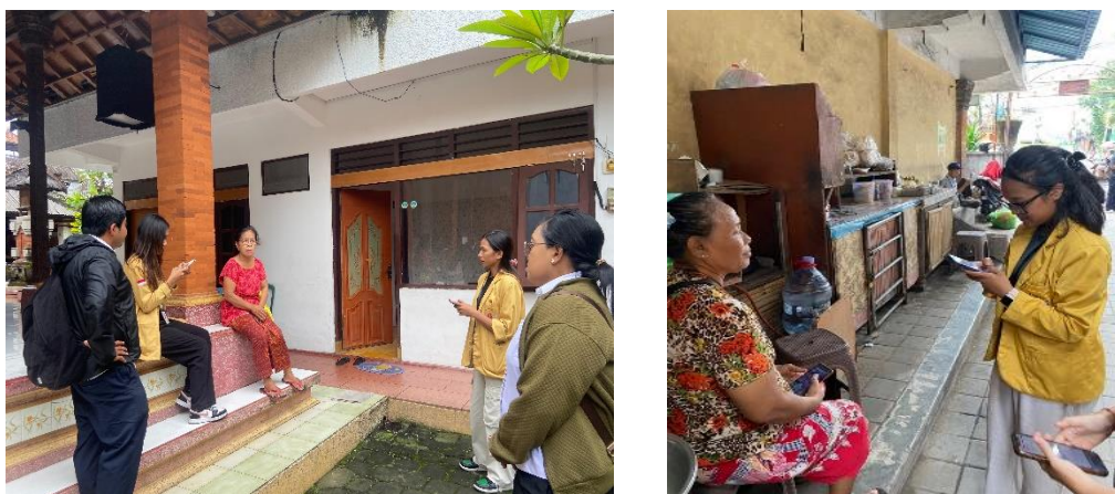
Gambar 2. Survei & Pemaparan Edukasi