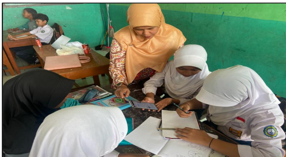
Gambar 4. Pelatihan kepada Siswa

Kegiatan pada gambar 3 yang dilakukan yaitu sosialisasi, cara pembuatan, dan manfaat menggunakan aplikasi android dalam pembelajaran matematika terhadap guru-guru mata Pelajaran matematika yang dilaksanakan di SMP Kutamekar. Dengan sosialisasi ini, diharapkan para guru dapat memahami peran penting penggunaan media pembelajaran berbasis android sebagai salah satu alternatif dalam pelaksanaan pembelajaran sehingga proses pembelajaran ini dapat berjalan dengan lancar dan mencapai tujuan yang diharapkan. Selain sosialisasi terhadap guru, tim PKM melakukan sosialisasi kepada siswa. Dapat dilihat kegiatan PKM terhadap siswa yang dilakukan pada gambar 4 dibawah ini.