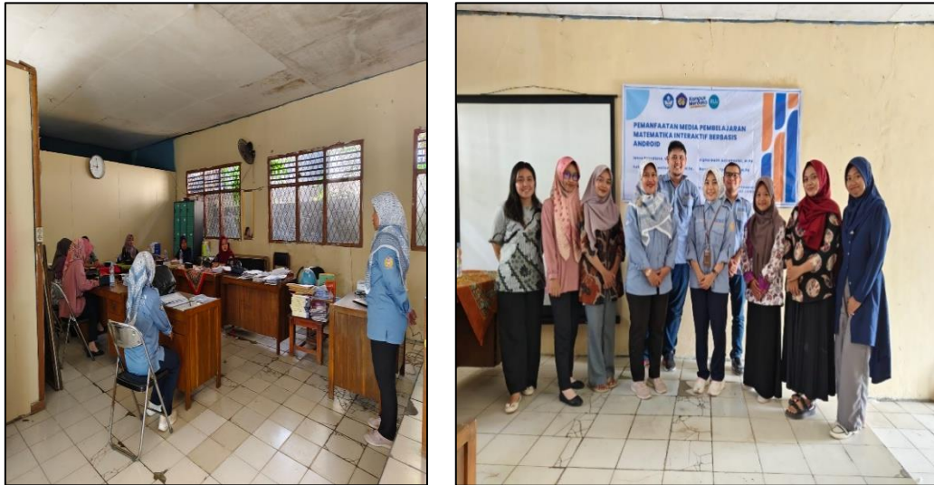
Gambar 3. Sosialisasi kepada Guru Mata Pelajaran Matematika

mengerjakan. Solusi selanjutnya yaitu pendampingan atau pelatihan yang diberikan kepada guru dan siswa, dapat dilihat pada gambar 3 dibawah ini.