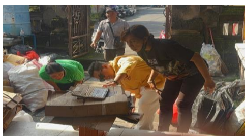
Gambar 5. Pendampingan Pemilahan Sampah pada Kegiatan Bank Sampah

Pendampingan yang dilakukan pada saat kegiatan bank sampah berlangsung memperkuat pemahaman masyarakat. Beberapa peserta bank sampah mulai membawa sampah yang telah dipilah sesuai kategori. Proses pendampingan dan interaksi langsung antara tim pengabdian dan masyarakat membantu memastikan bahwa materi edukasi yang disampaikan melalui brosur dapat diterapkan secara nyata.