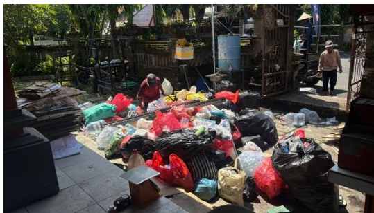
Gambar 3. Kondisi Tempat Pemilahan Sampah

besar sampah rumah tangga yang disetorkan ke bank sampah masih tercampur antara sampah organik, anorganik, dan B3. Diskusi dengan pengelola bank sampah mengungkapkan bahwa kondisi tersebut menyebabkan pengelola masih harus melakukan pemilahan ulang, sehingga mengurangi efektivitas pengelolaan sampah. Selain itu, masyarakat menyampaikan bahwa mereka belum memiliki panduan praktis yang sederhana dan mudah dipahami terkait cara memilah sampah sejak dari rumah.