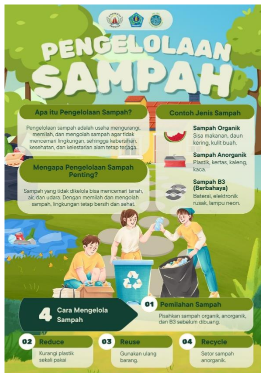
Gambar 2. Brosur Edukasi Pengelolaan dan Pemilahan Sampah

Kegiatan edukasi dilaksanakan pada tanggal 08 Februari 2026 bertempat di lokasi kegiatan bank sampah Desa Dangin Puri Kangin. Edukasi dilakukan dengan metode penyebaran brosur yang disertai dengan penjelasan langsung kepada masyarakat oleh tim pengabdian. Penyampaian materi dilakukan secara interaktif, dengan memberikan contoh langsung jenis-jenis sampah yang sering ditemui dalam kehidupan sehari-hari. Pada tahap ini, brosur tidak hanya dibagikan, tetapi juga dijelaskan isi dan maknanya agar masyarakat memahami cara menerapkan informasi yang terdapat di dalamnya. Interaksi langsung ini bertujuan untuk memastikan bahwa pesan edukasi tidak hanya diterima, tetapi juga dipahami dengan baik.