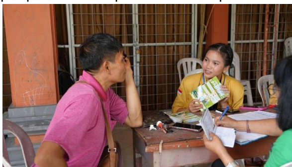
Gambar 4. Kegiatan Penyebaran Brosur Edukasi Pemilahan Sampah

Setelah dilakukan edukasi melalui penyebaran brosur pengelolaan dan pemilahan sampah, terjadi perubahan positif dalam pemahaman dan sikap masyarakat. Brosur yang disampaikan secara visual dan disertai penjelasan langsung membantu masyarakat memahami jenis-jenis sampah serta cara pengelolannya. Masyarakat terlihat antusias menerima brosur dan aktif bertanya mengenai penerapan pemilahan sampah dalam kehidupan sehari-hari.