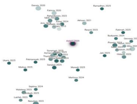
Gambar 1. Lanscape PKM pada warga binaan di Indonesia

Selain itu, pengabdian kepada masyarakat yang berfokus pada anak binaan khususnya laki laki masih kurang di perhatikan dari institusi pendidikan, hal ini dapat dilihat dari kecondongan masyarakat melakukan penelitian selama ini lebih kepada warga binaan secara umum atau binaan perempuan (Fajri et al., 2024; Mufti & Riyanto, 2023; Soliha & A., 2024). Padahal remaja laki laki/binaan anak lelaki lebih genting terpapar dengan aktifitas yang negatif kembali ketika mereka selesai dari tempat pembinaan ini kelak. Sehingga hal ini perlu di berikan motivasi dan pemahaman akan rencana positif kedepannya nanti, serta dibentengi dengan prinsip prinsip hidup yang baik.