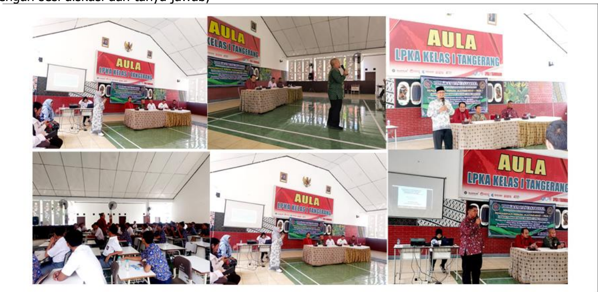
Gambar 4. Kegiatan 2 Pemaparan materi yang disampaikan oleh dosen Pasca UMT di LAPAS khusus anak kelas 1 Tangerang

segenap peserta mendengarkan paparan materi dari para pemateri dan dilanjutkan dengan sesi diskusi dan tanya jawab;