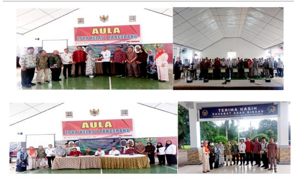
Gambar 3. Kegiatan 1 penerimaan PKM UMT di LAPAS khusus anak kelas 1 Tangerang

1 Tangerang-Banten. Beliau sangat senang dengan sinergi antara perguruan tinggi dan LPKA karena untuk membantu memperbaiki generasi/anak binaan ini merupakan tanggung jawab bersama. Pendidikan tinggi yang merupakan salah satu penentu arah generasi kedepannya perlu berbagi motivasi dan arahan kepada anak binaan, sehingga harapannya kerja sama ini akan terus berjalan dan saling bersinergi (Jirapong et al., 2021; O'Dwyer et al., 2023; Rybnicek & Königsgruber, 2019).