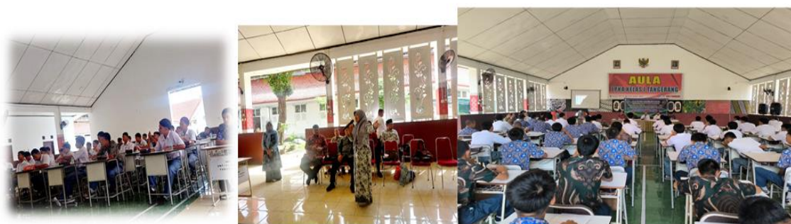
Gambar 5. Antusiasme anak binaan dan rasa ingin tahun siswa

Berdasarkan peraturan LAPAS KHUSUS ANAK kelas 1 Tangerang, dokumentasi terkait anak binaan perlu diminimalisir, hal ini terkait dengan privasi dan perspektif sosial. Sehingga foto foto berikut banyak di ambil dari tampak belakang atau menghindari muka peserta yang terlalu tampak.