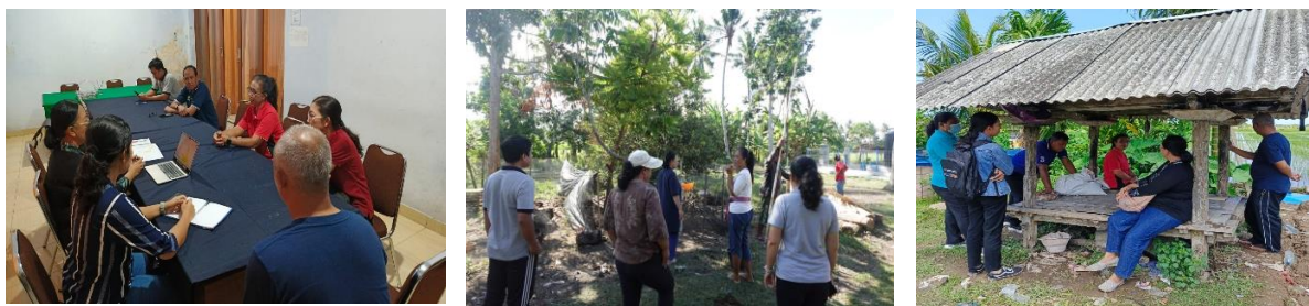
Gambar 3. Kegiatan wawancara dan observasi

Tahapan kedua adalah observasi lapangan yang bertujuan untuk memperoleh gambaran nyata mengenai kondisi KWT Sari Bumi Lestari dan lingkungan usahataniya. Kegiatan observasi difokuskan pada struktur organisasi kelompok, pola interaksi antar anggota, aktivitas produksi pertanian dan peternakan, pemanfaatan aset kelompok (lahan, ternak, kolam ikan, dan rumah kaca), serta praktik administrasi dan pencatatan keuangan yang berjalan. Hasil observasi awal menunjukkan bahwa permasalahan utama KWT Sari Bumi Lestari tidak terletak pada ketiadaan sumber daya, melainkan pada lemahnya sistem pengelolaan organisasi yang mengintegrasikan sumber daya tersebut. Meskipun KWT memiliki beragam aset produktif (seperti lahan pertanian, ternak, kolam ikan, dan rumah kaca) namun aset tersebut belum dikelola secara optimal. Kondisi ini disebabkan lemahnya tata kelola organisasi dan minimnya perencanaan jangka menengah. Informasi hasil wawancara dan observasi digunakan sebagai dasar penyusunan materi penyuluhan dan strategi pendampingan yang sesuai dengan kondisi nyata mitra. Kegiatan wawancara dan observasi disajikan pada Gambar 3.