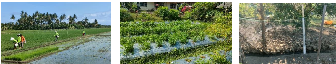
Gambar 1. Potensi sumber daya pertanian dan peternakan yang dikelola KWT Sari Bumi Lestari

Adapun potensi sumber daya pertanian dan peternakan yang dikelola KWT Sari Bumi Lestari disajikan pada Gambar 1.