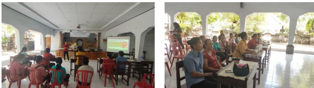
Gambar 4. Penyuluhan dan pendampingan KWT

Pendampingan ini bertujuan untuk memperkuat kesiapan anggota KWT dalam mengelola bantuan dan aset secara lebih produktif dan berkelanjutan. Adapun kegiatan penyuluhan dan pendampingan disajikan pada Gambar 4.