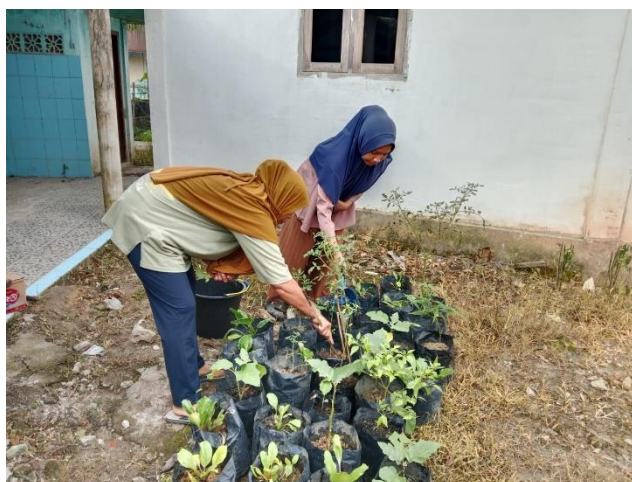
Gambar 2. Pengaplikasian Pupuk Organik Cair di Kebun PKK Desa Gunung Raja

Selain peningkatan pengetahuan, kegiatan ini juga berdampak pada perubahan sikap dan motivasi peserta. Tingginya skor pada komponen kepedulian lingkungan dan motivasi untuk membuat POC secara mandiri menunjukkan adanya kesadaran baru akan pentingnya pengelolaan limbah rumah tangga yang ramah lingkungan. Pemanfaatan limbah seperti sisa sayuran, kulit buah, dan air cucian beras sebagai bahan POC dapat mengurangi volume sampah rumah tangga sekaligus menghasilkan produk yang bermanfaat bagi tanaman di pekarangan rumah (Pawestriningtyas, et al., 2023).