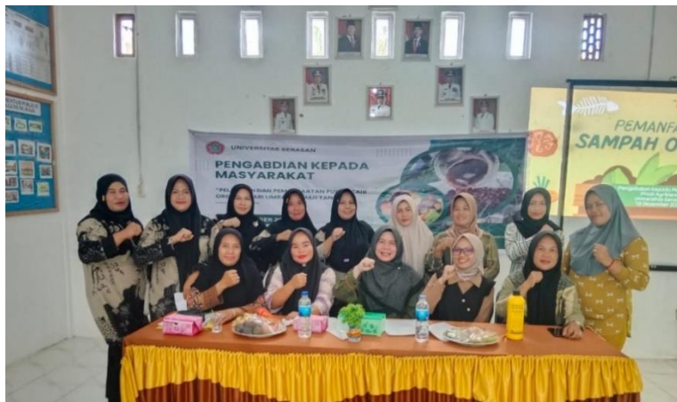
Gambar 1. Foto Bersama Kegiatan Pengabdian Kepada Masyarakat Desa Gunung Raja

dalam proses pembelajaran dan praktik pembuatan POC. Pendekatan PAR juga dapat merubah hubungan antar pribadi (Rahmat & Mirnawati, 2020) seperti hubungan bagaimana fasilitator memahami perannya sehingga bisa bekerja satu sama lain agar kegiatan ini melibatkan peserta secara aktif (Wahyuni, et al., 2025).