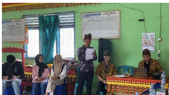
Gambar 2. Salah satu peserta memberikan umpan balik pelatihan

Hasil kegiatan menunjukkan bahwa pelatihan ini mampu meningkatkan pemahaman dan keterampilan peserta dalam menguasai Pepaccogh sebagai tradisi lisan Lampung. Sebelum kegiatan, sebagian besar peserta hanya mengenal Pepaccogh sebagai "tradisi lama" yang sering digunakan dalam acara tradisional, tanpa memahami makna filosofis atau aturan yang mendasarinya. Setelah pelatihan, peserta mengaku lebih memahami esensi Pepaccogh sebagai sarana komunikasi tradisional yang sarat dengan pesan moral, pendidikan, dan identitas budaya. Kegiatan pengabdian ini tidak berhenti pada pelatihan saja. Melalui pendampingan yang berkelanjutan, diharapkan masyarakat Desa Negeri Katon mampu mengintegrasikan tradisi Pepaccogh ke dalam kegiatan pendidikan, keagamaan, dan sosial masyarakat.