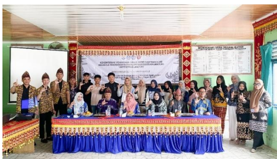
Gambar 1. Seluruh Peserta Pelatihan

Dalam pelaksanaannya, para peserta pelatihan dapat menyusun teks Pepaccogh sederhana sesuai dengan konteks acara tertentu, seperti acara pernikahan tradisional, penyambutan tamu, dan kegiatan upacara desa. Selain itu, beberapa peserta pemuda menunjukkan semangat untuk mendokumentasikan hasil pelatihannya dalam bentuk video dan tulisan, sehingga membuka peluang pengembangan media digital berbasis budaya lokal. Hal ini sejalan dengan tujuan literasi budaya, yaitu tidak hanya memahami tradisi secara pasif, tetapi juga untuk dapat mengubahnya menjadi bentuk-bentuk baru yang relevan dengan perkembangan zaman.